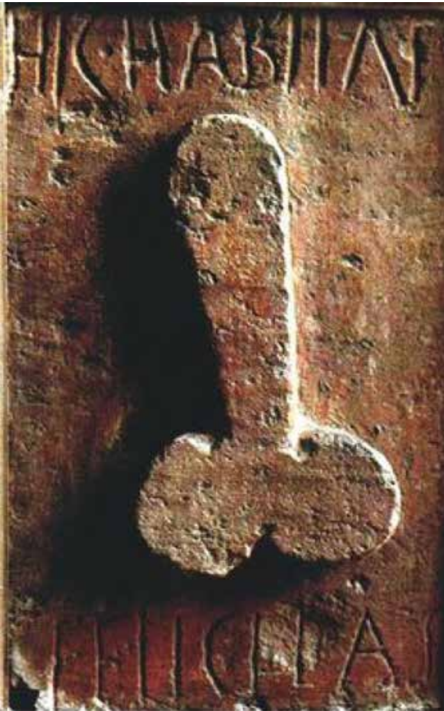
Fig. 3. Relievo dun falo na parede dunha panadería de Pompeia ca lenda Hic Habitat Felicitas (Aquí habita a felicidade).

como poden ser: gravados, incisións, representacións moldeadas, mosaicos e, incluso, relevos en esculturas ou obras públicas e privadas. Debe quedar claro que en ningún caso estas imaxes poden ser consideradas como mostra de indecencia ou indecoro, todo o contrario, como queda demostrado ó aparecer frecuentemente acompañados de expresións de felicidade e fortuna, acentuando a hospitalidade de cara ós visitantes (Fig.3).