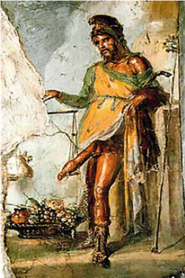
Fig. 1. Fresco de Príapo pesando o seu membro nunha balanza contra a ganancia obtida nas súas leiras (casa dos Vettii, Pompeia).

Por outra parte, os trazos comúns que Príapo compartía con outros antigos deuses da fertilidade favorecía os casos de sincretismo relixioso, tanto con deuses propios do panteón romano (Dionisio, Hermes, Mercurio), como con deuses celtas ou xermánicos, feito este favorecido tamén nestes casos pola coñecida interpretatio romana .