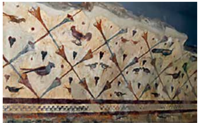
Fig.2. Representación dos galli (galos) xunto con outras galináceas nos murais de Santa Eulalia de Bóveda (Lugo).

fertilidade da terra, deusa tamén dos animais. O seu culto, de ampla difusión, era proporcionado por uns sacerdotes sometidos á autocastración coñecidos como galli , polo que era usual a representación deste tipo de animais nos elementos ou lugares de culto destinados a adorar á deusa. Un posible exemplo poderían ser os galos representados no templo de Santa Eulalia de Boveda (Fig.2), que identificaría a este edificio como un lugar de culto dedicado a Cibeles (ERIAS MARTÍNEZ, 2015).