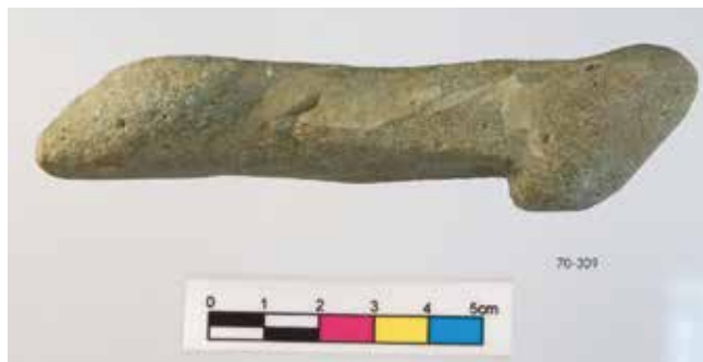
Fig. 7. Amuleto fállico en cuarcita gris (1970/00309).

Procedencia: Castro de Viladonga. Escavación de 1970.