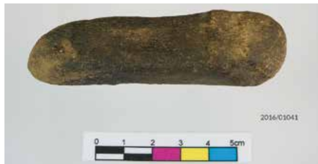
Fig. 6. Amuleto fálico en cuarcita (2016/01041).

Procedencia: Castro de Viladonga. Escavación de 2016.