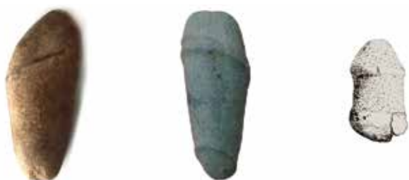
Fig.5. Representación de amuletos fálicos atopados en contextos castrexos. (A partir de ERIAS MARTÍNEZ, 2015).

testículos. O exemplar atopado en Socastro ten a particularidade de presentar restos de pintura que axudan a remarcar o de por si remarcado glande. Para Erias Martínez o feito de estar pintado implicaría unha vontade de darlle maior realidade e remarca o feito de ser un falo cortado (sen testículos), o que, para este autor, podería indicar que formara parte dun santuario de Attis e Cibeles (ERIAS MARTÍNEZ, 2015).