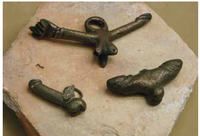
Fig. 4. Titus con alas, figa con falo e fascinum galo-romanos procedentes de Reims. Musée Saint-Remi, Reims.

O obxectivo deste artigo non é o de entrar en detalles sobre a clasificación tipolóxica da variedade de amuletos existentes en época romana, pero si que nos gustaría facer referencia a algún dos tipos xerais máis representativos (Fig.4), nos que entrarían os falos alados ou Titus , o fascinum e a figa ( manus fica ). Tamén nos parece interesante sinalar que a representación de varios tipos nun mesmo amuleto reforzaría o seu poder protector, sendo común a unión de falo e figa nun mesmo colgante. Nalgúns casos, como podemos ver no enxoval funerario presente nalgúns tumbas, os tintinnabula , falos e figas aparecen tamén asociados a outros elementos rituais (cravos, moedas) como reforzo da protección necesaria ante o mundo ignoto da morte (VAQUERIZO, 2010; 41).