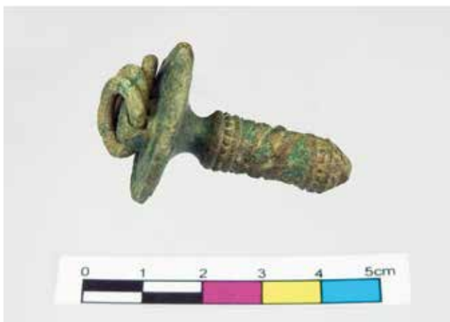
Fig. 9. Fascinus ou colgante fálico realizado en bronce. Foto: Marta Cancio (Museo do Castro de Viladonga).

Procedencia: Descoñecida (Depósito Xudicial).