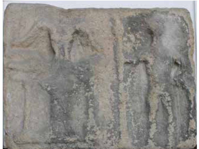
Fig. 4. Relevo de Xúpiter