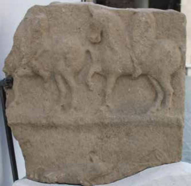
Fig. 1. Estela de Atán