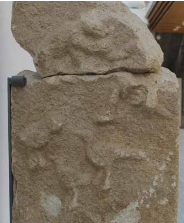
Fig. 2. Estela de Adai