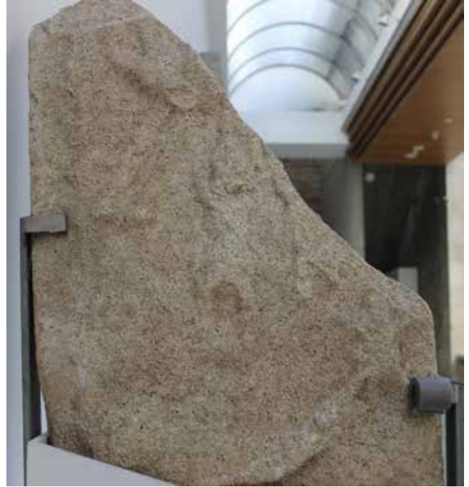
Fig. 3. Estela da Loba Capitolina