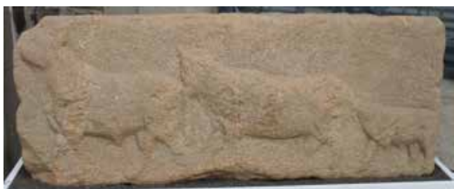
Fig. 5. Relevo de Becerreá