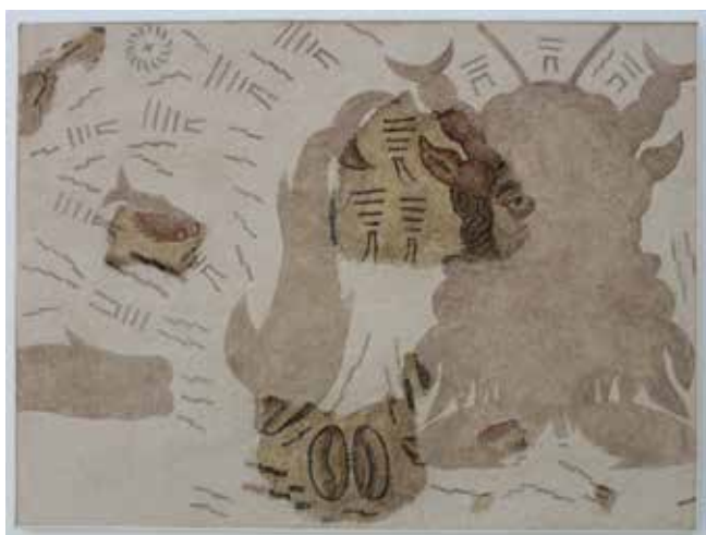
Fig. 6. Mosaico de Batitales