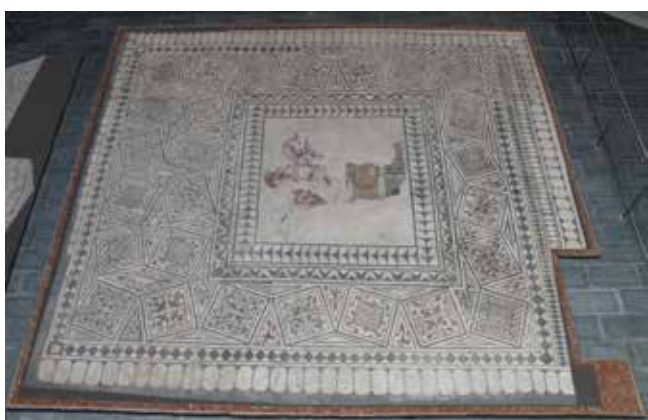
Fig. 7. Mosaico de Dédalo e Pasifae