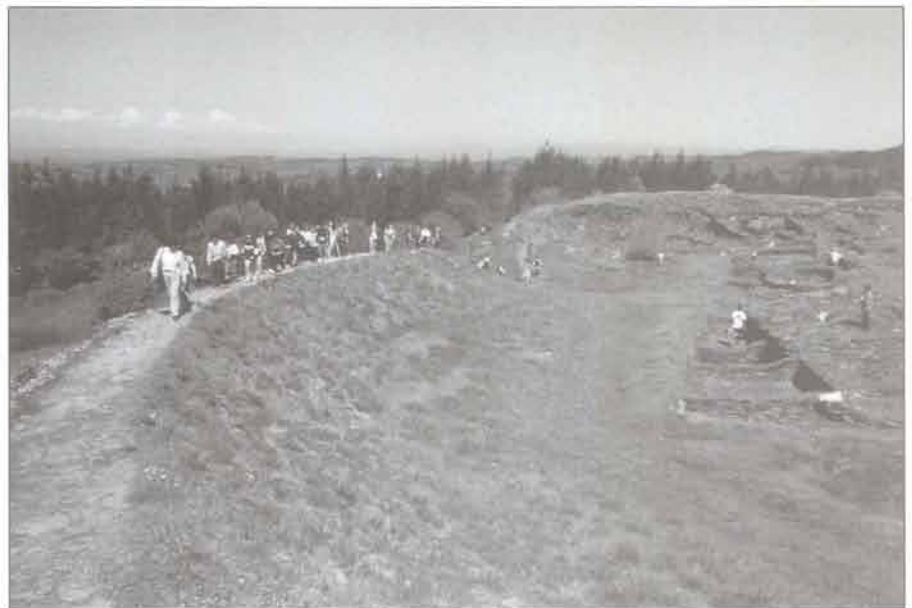
Visita no Castro

antepasados e a aprecia-las formas de vida de persoas moi distantes no tempo