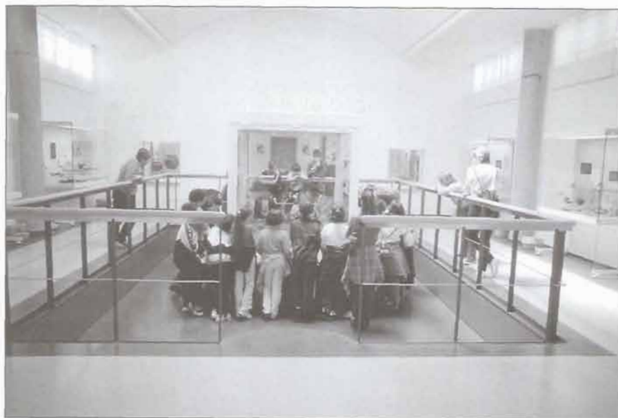
Visita no Museo.

- Para a cronoloxía, sabe-la denominación, orde e sucesión das grandes