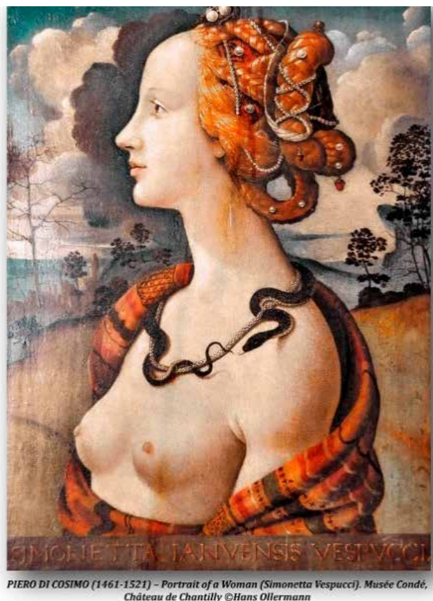
Fig.5 Cosimo, Piero de. Retrato de Simonetta Vespucci

Quizais sexa a época medieval a que máis escurantista se volta en torno a produción de xoias individualizadas, sobre todo das femininas, xa que aquí ten máis importancia o mundo do vestir e das toucas, tendo moita variedade de mantos, capas, toucados e coroas. A xoiería máis importante atopámola nos aneis papais e nos báculos onde se engastaban pedras preciosas e xemas (Fig.4), namentres a feminidade víase máis limitada e coartada, relegándoa ao mundo do decoro e do pudor, non será ata o renacemento cando a muller rexurda como unha «Venus» fermosa e dona da súa beleza, permitindo a aparición de cadros como o de Simonetta Vespucci de Piero di Cosimo (Fig.5), onde a muller loce os seus senos espidos que contrasta cun colar no que se enrola un áspid que se salienta máis polo rubor da pel espida da muller e reluciente, en repousada e calmada actitude de contemplación; algo impensable na idade media pero que cobra forza no renacemento que fai da muller unha nova «Venus», e afonda moito nesta temática, tal como se ve no cadro de «Amor sacro, amor profano» de Tiziano (Fig.6)