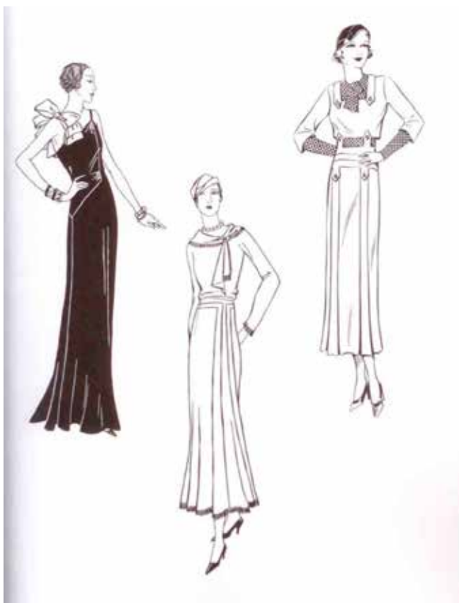
Fig. 9 Modelismo tipos anos 20. Fondos do Museo Pazo de Tor (Monforte de Lemos)