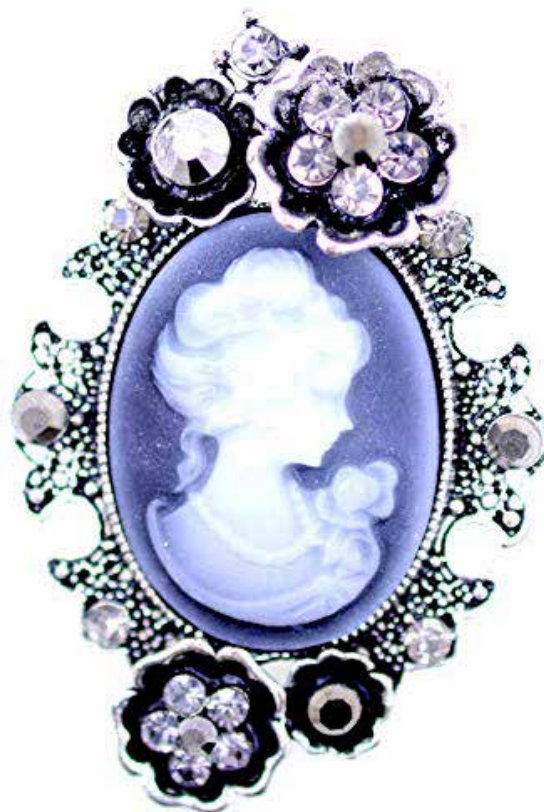
Fig. 12 Camafeo de tipo victoriano.

Xoias que contrastaban cunha recorrencia ao negro na indumentaria e irrompían fortemente no panorama dunha sociedade, como xa dixemos anteriormente, moi asfixiante e encostelada que facía á muller mística e submisa. Esta é unha época que fixo marca de identidade unha xoia insubstituíbel e inesquecible como o foi o camafeo, unha curiosa xoia que co tempo írase modificando. Existindo versións que levan dentro fotografías de persoas achegadas falecidas ou namorados, ou mesmo incluso tamén se deron os " gardapelos " (Fig.12)