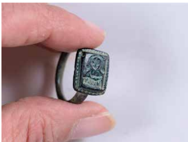
Fig. 4 Anel medieval de San Nicolás

Quizais sexa a época medieval a que máis escurantista se volta en torno a produción de xoias individualizadas, sobre todo das femininas, xa que aquí ten máis importancia o mundo do vestir e das toucas, tendo moita variedade de mantos, capas, toucados e coroas. A xoiería máis importante atopámola nos aneis papais e nos báculos onde se engastaban pedras preciosas e xemas (Fig.4), namentres a feminidade víase máis limitada e coartada, relegándoa ao mundo do decoro e do pudor, non será ata o renacemento cando a muller rexurda como unha «Venus» fermosa e dona da súa beleza, permitindo a aparición de cadros como o de Simonetta Vespucci de Piero di Cosimo (Fig.5), onde a muller loce os seus senos espidos que contrasta cun colar no que se enrola un áspid que se salienta máis polo rubor da pel espida da muller e reluciente, en repousada e calmada actitude de contemplación; algo impensable na idade media pero que cobra forza no renacemento que fai da muller unha nova «Venus», e afonda moito nesta temática, tal como se ve no cadro de «Amor sacro, amor profano» de Tiziano (Fig.6)