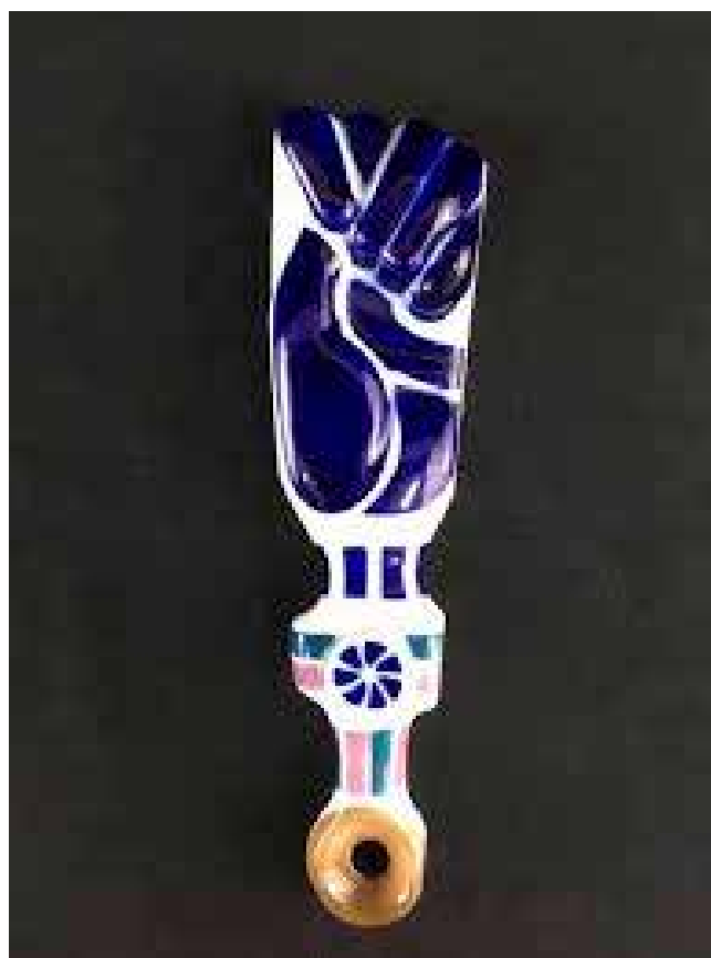
Fig. 11 Figa. Recreación cerámica de Sargadelos

Polo medio deste trepidante mundo, non debemos esquecer que as xoias non só nacen como mero aditamento decorativo, senón que moitas foron creadas como amuleto, como auténticos elementos profilácticos de protección contra o mal de ollo e as supersticións. Temos un excepcional exemplo na nosa historia galega como é a figa, feita en acibeche, unha pedra fósil, mística e dotada dun halo de gran misterio pola súa capacidade de imantarse atraendo outros obxectos. Esta especial característica de imantarse dálle un selo especial ao acibeche, moi vencellado á cultura galega, e reproducido por Sargadelos na súa versión de sinal propia (Fig.11).