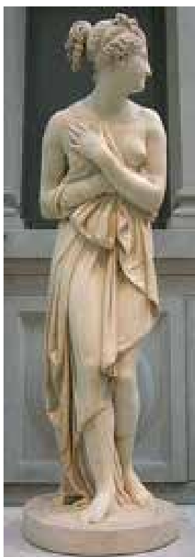
Fig. 7 Canovas. Escultura neoclásica

Do Renacemento, pasamos ao manierismo, antesala da aparición do Barroco, movemento artístico onde xa comezan as carnosidades e o gusto pola voluptuosidade, mitigándoa a sobriedade dun neoclasicismo palpitante que impón formas académicas con Canova (Fig.7) que buscan a sinxeleza e pureza das formas, non tan complexas, senón de liñas menos recargadas e máis fluídas, que marcan un novo canon creativo e compositivo.