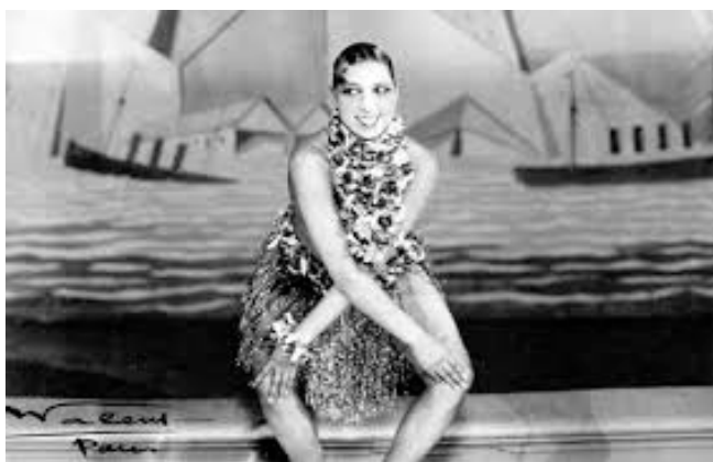
Fig. 10 Baker, Joséphine. Bailarina de charlestón no Folies Bergerée, Paris (1926)

Polo medio deste trepidante mundo, non debemos esquecer que as xoias non só nacen como mero aditamento decorativo, senón que moitas foron creadas como amuleto, como auténticos elementos profilácticos de protección contra o mal de ollo e as supersticións. Temos un excepcional exemplo na nosa historia galega como é a figa, feita en acibeche, unha pedra fósil, mística e dotada dun halo de gran misterio pola súa capacidade de imantarse atraendo outros obxectos. Esta especial característica de imantarse dálle un selo especial ao acibeche, moi vencellado á cultura galega, e reproducido por Sargadelos na súa versión de sinal propia (Fig.11).