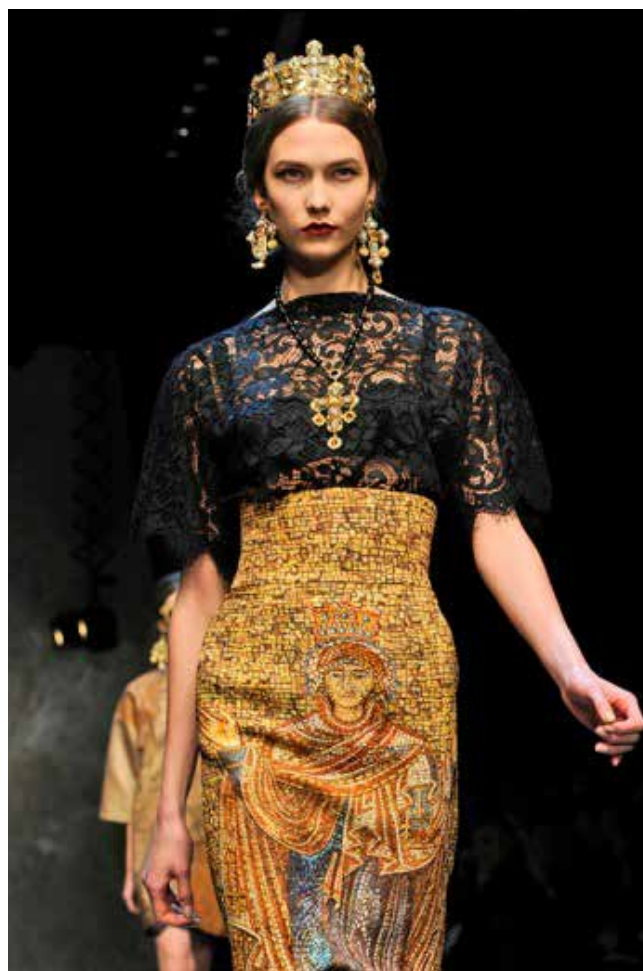
Fig.3 Dolce& Gabana. Moda de inspiración bizantina en pasarela

Célebres son as técnicas do esmaltado e do "cloissoné" que permitiron incluso traballar con marfil creando unha magnífica arte do marfil. Unha proba de que o pasado non languidece, foi a traída do mundo bizantino ao presente da man dos deseñadores de moda de Dolce&Gabana, que se deixaron embriagar desta cultura para introducila nas súas creacións. O resultado foi unha colorista pasarela que reviviu Bizancio por un día. (Fig.3)