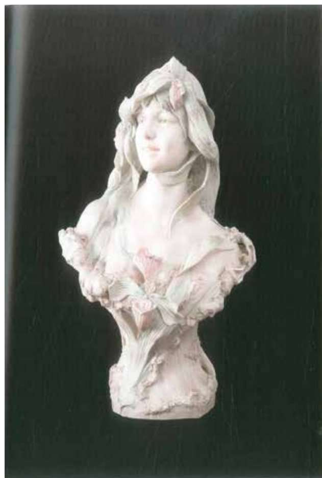
Fig. 8 Busto feminino. Fábrica Royal Dux

Entramos de cheo no Rococó, onde o recargado cobra moito auge e invade todo, a base de formas florais e vexetais, moi carnosas e con certos tons de rosa empoadado e matices suaves que fan elaborar xoias nesta mesma liña. Un exemplo destas tonalidades é este busto feminino que figura no Museo Provincial de Lugo (MPL) (Fig.8), que se trae a colocación para plasmar este universo cromático no mundo material e tamén no aspecto íntimo e persoal das xoias.