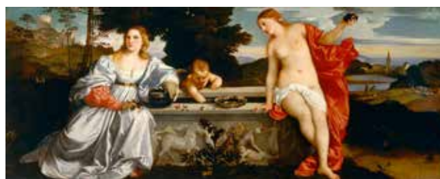
Fig. 6 Tiziano. Amor sacro, amor profano