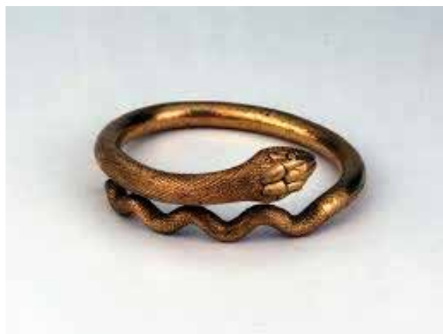
Fig. 1 British Museum. Xoia romana, brazaletes serpentiforme

O feito de pasar da pedra aos metais, permitiu a creación de diferentes técnicas que permitían a amalgama de diferentes materiais creando xa aliaxes entre bronce, prata, ouro... e, dando como resultado, a creación de novas xoias que permitían aumentar o repertorio fabril creando decoracións incisas, incrustacións doutras pedras preciosas, engarces que abriron a porta a un febril universo de creacións novidosas e orixinais do que o mundo romano garda moitos exemplos de soberbias xoias (Fig.1)