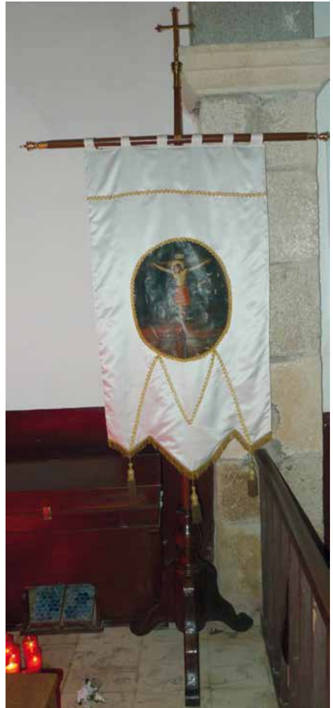
Estandarte do Santo Cristo.

dominica de 1827 " 45 . A partir do ano 1873 encetouse a vender dende a propia organización do recinto sacro "hábitos ou mortallas"; isto deu lugar a que o caudal de esmola, que acadaba o santuario, fose aumentando. "1902. 8 ptas. de hábitos, de percalina morada y de colores, que se venden para mortajas de gente muy pobre y para párvulos" 46 . En relación á festividade relixiosa a esmola utilizouse nos oficios relixiosos da primeira dominica de setembro, nos que participaban un número variable de cregos 47 ; tamén na novena do Santo Cristo. Así mesmo, a partir do ano 1956 empezouse a pagar a misa solemne do luns. Con respecto á festividade profana, a esmola usouse ao principio na compra dos foguetes; e, logo, tamén nas bandas e grupos musicais. "1893. De pirotecnia, según costumbre, 300 rs, es decir, 75 ptas. De banda de música, 160 rs, 40 ptas" 48 . "1926. Banda de música y fuegos artificiales, 200 ptas" 49 ; a finais da década dos setenta e principios da dos oitenta do século pasado, o párroco concedeulle anualmente á comisión de festas, 6.000 ptas. O resto da esmola, que recibiu o depositario, ou os demandantes da mesma, foi empregada polo párroco da freguesía coa conformidade dos veciños da parroquia. Así, usouna para mercar vestimenta e obxectos de índole relixiosa, relacionados co culto existente no santuario; e, tamén, en arranxos e obras de carácter interno e externo ao templo.