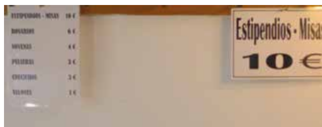
Prezo dalgunhas ofrendas e obxectos relixiosos.