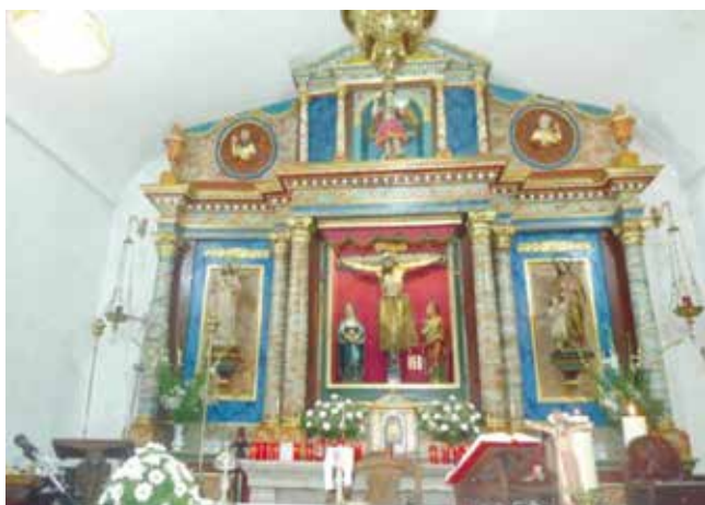
Altar central do recinto sacro.

A relixiosidade de cada pobo, como todo fenómeno vivo, ten os seus trazos especiais. Cada comunidade vive e manifesta a fe dun xeito propio. Unha relixiosidade é popular cando se configura con ese pobo e manifesta o seu sentir. É parte da cultura, dun modo de pensar e de vivir. Para comprendela cómpre ter en conta o pasado; o que na actualidade a rodea; os trazos do lugar; o estilo das persoas; como viviron o cristianismo; que é o que herdaron dos séculos pasados; que é o que cada unha das xeracións recibiu e achegou. Polo tanto, é popular o que o pobo crea mais tamén o que recibe, asimila e fai propio. Unha das manifestacións da relixiosidade popular radica nos santuarios.