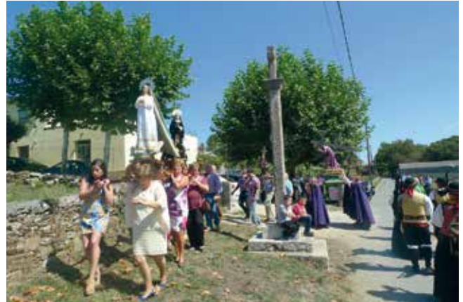
A procesión circunda o cruceiro.

Un dos obxectivos básicos da procesión é que a imaxe de devoción saía temporalmente do seu espazo sagrado para renovar e potenciar a súa acción protectora e purificadora de cara ao exterior. Deste xeito a imaxe acada a plenitude da súa funcionalidade.