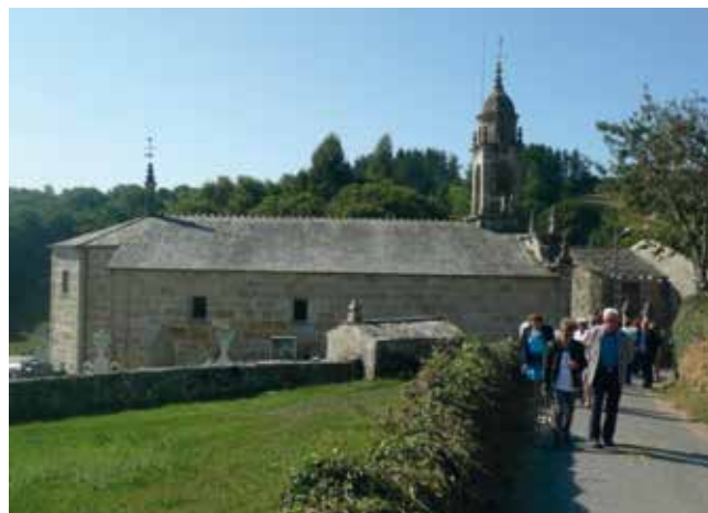
Vista exterior do Santuario de Goián.