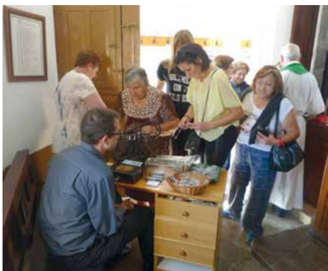
Devotos ofrecendo misas e mercando obxectos relixiosos.