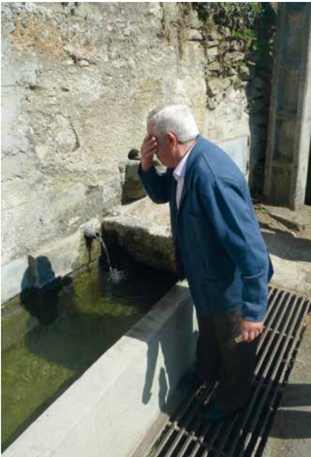
Ritual da Fonte.

Algúns devotos beben a auga da fonte e, tamén, levan o prezado líquido en botellas para as súas casas. Así mesmo, hainos que lavan a súa cara e os seus ollos. A función destes actos é de carácter profiláctico e sandador.