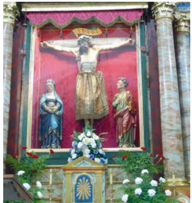
Advocación cristolóxica no altar central.

Neste santuario cómpre facer alusión a tres arquetipos de interacción entre os devotos e a advocación cristolóxica: así, o máis habitual é que a promesa sexa “a posteriori”; é dicir, a entidade sacra outorga a petición ao devoto e, logo, este realiza a promesa. Esta modalidade recibe tamén o nome de “ofrenda condicionada” 55 . Sen embargo, hai devotos que levan a cabo unha serie de rituais e ofrendas no intre de pregar a mediación da divindade ante un problema determinado; trátase dun cumprimento “a priori”, xa que os diferentes rituais e ofrendas teñen lugar denantes de que sexa concedida a petición. Esta forma de relación recibe o nome de “devoción peticionaria” 56 . Finalmente, outro modo de interacción dos devotos coa entidade sacra e acudir todos os anos en gratitude ao don concedido antano. Sería, polo tanto, unha ofrenda de acción de grazas.