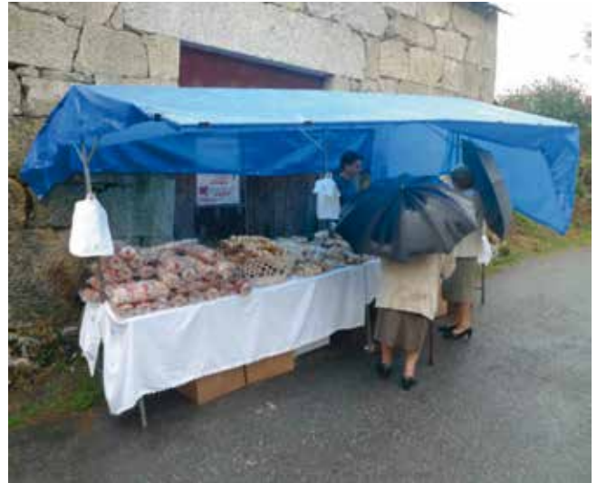
Posto de rosquillas.

Denantes de retornar aos seus lugares de orixe, algúns devotos levan algún recordo do santuario. Así, adoitan mercar algún obxecto relixioso, como unha pequena imaxe do Santo Cristo; unha capeliña; un rosario; unha estampa. Hainos que mercan unha tira de rosquillas dun posto, situado ao carón do recinto sacro; o seu prezo era de 3 euros nos anos 2014 e 2015. Finalmente, un pequeno grupo, asistente á misa solemne e á procesión, -no que incluimos aos invitados dos parroquiáns- participan dun tempo de lecer, que ten lugar nun campo, situado preto do santuario. Alí, xa o sábado pola noite, realízase unha churrascada e pancetada; e, logo, case sempre un dúo musical ameniza o resto da noite. Nos días seguintes, domingo e luns, un grupo musical e dúas orquestras seguen amenizando as sesións vermú e as verbenas, nas que se reflicte a mestura do grupo parroquial co foráneo. Non obstante na actualidade, cando hai algunha festa na comunidade parroquial, algúns dos poucos mozos, que fican na mesma, adoitan non participar nas verbenas. O motivo é debido á implantación de novas pautas de lecer pola bisbarra.