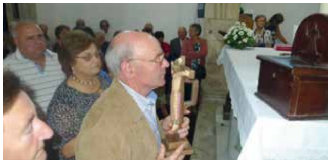
Ritual de “autoimposición”.

Hai devotos, que collen unha imaxe pequena do Cristo, situada enriba do altar central; bícana unha e máis veces e, posteriormente, deixan unha esmola nun petitorio, colocado ao seu carón.