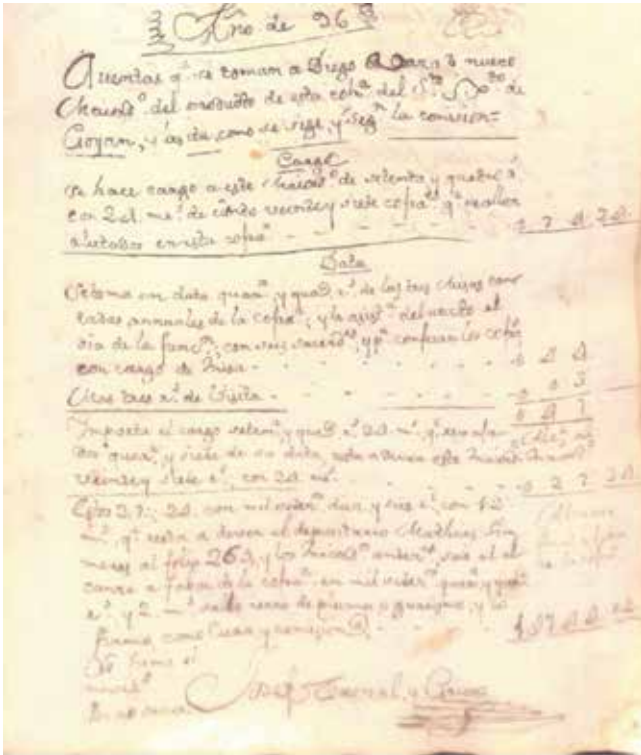
Confraria do Santo Cristo. Aportacións e gastos.