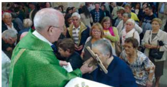
Ritual de “poñer o Santo”.

“Rituais de contacto como “poñer o santo”... ou de tocar obxectos na imaxe para levalos á casa como portadores de graza ou poder do santuario, poden ser clasificados como formas de “maxia contaminante,” inspirada pola “lei de contacto,” que se basea no principio de que un obxecto posto en contacto con outro adquire as virtudes deste” 61 .