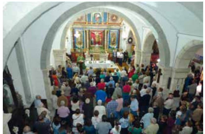
Crego oficiando unha misa.

En ambos os dous días os devotos ofrecen unhas 130 misas, que o párroco irá oficiando no transcurso do ano. O prezo de cada misa é de 10 euros.