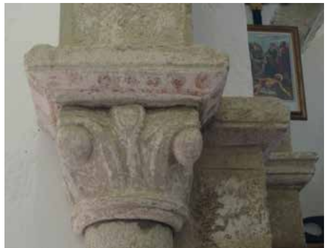
Capitel de estilo románico.

2. A segunda etapa é de estilo románico, moi adiantado, que podemos situar a comezos do século XIII 22 . Isto está reflectido en ambas as dúas semicolumnas existentes na nave Sur, que actúan de sostén do arco triunfal e que amosan unhas bases molduradas por riba duns plintos, ornados con pequenos arcos; tamén mostran uns capiteis, ornamentados de diferente xeito: o dereito, con follas que rematan en bolas e o esquerdo cuns tallos estilizados con pequenas follas nos seus lados e rematados nunha roseta.