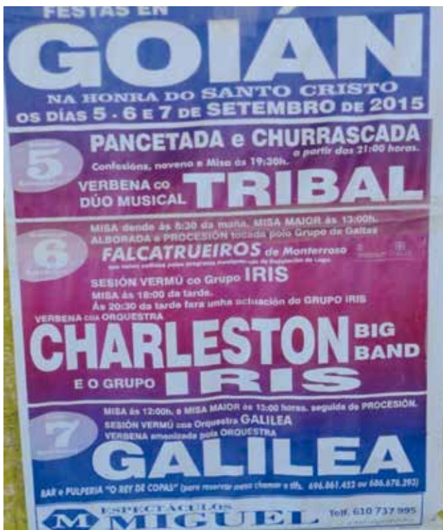
Programa de festas. Ano 2015.

A festa profana, ligada ao Santo Cristo, realízase co diñeiro, que lle dan á parroquia de Goián pola instalación dalgúns muíños eólicos no seu monte; tamén, da lotería que os ramistas venden no Nadal; da venda de rifas, destinadas ao sorteo dalgúns animais domésticos: cordeiros, cabritos...; así mesmo cómpre sinalar a contribución de varios donativos para este fin.