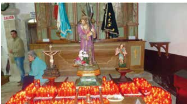
A capela do Santo Cristo con ofrenda de “velóns”

2º. O retablo da “Capela do Santo Cristo”, que contén as seguintes imaxes: a da Virxe dos Ollos Grande, do século XVIII; a de San Sebastián, do XIX; e a da Virxe co Neno, do XVI.