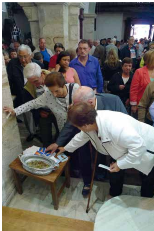
Alguns devotos recollen unha estampa do Santo Cristo e doan unha esmola.

O cumprimento das promesas non so se realiza os días da festividade no santuario, senón que en calquera domingo do ano acoden fieis e devotos doutras comunidades parroquiais para pregar ao Santo Cristo a súa intercesión ante unha serie de peticións.