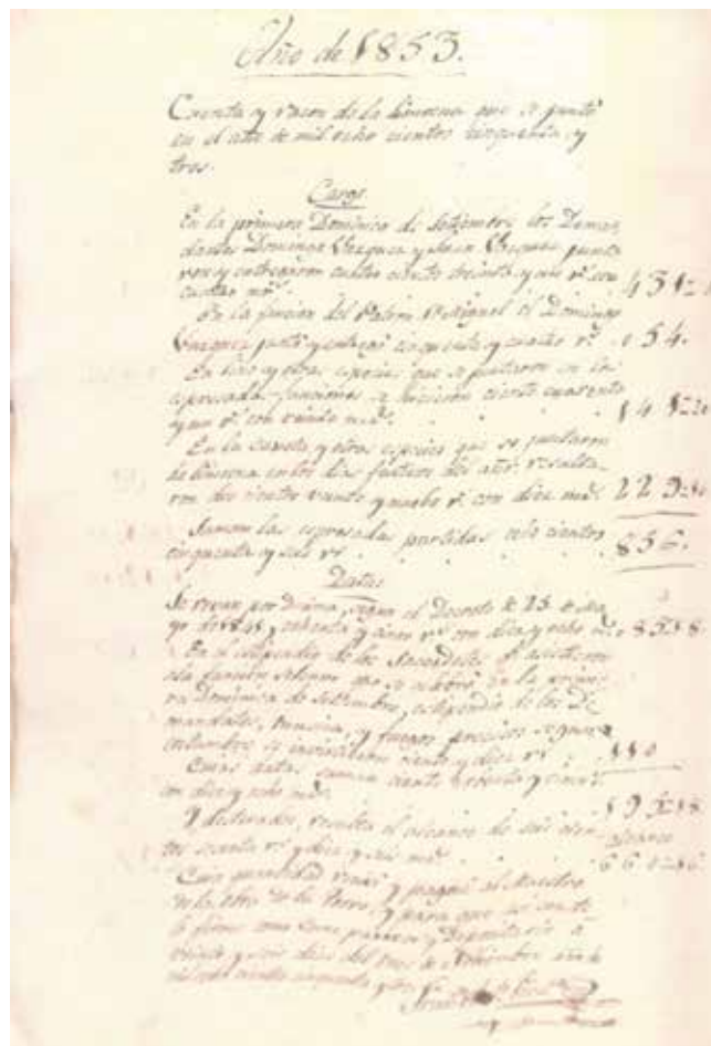
Confraría do Santo Cristo. Achegas e gastos.

Ao rematar o ano 1984 as contas do Santuario do Santo Cristo de Goián pásanse ao Libro de Fábrica das igrexas de Goián e Vilapedre, non quedando nin remanente nin déficit.