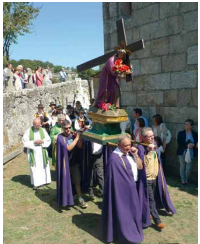
A procesión percorre o perímetro do santuario dúas veces.