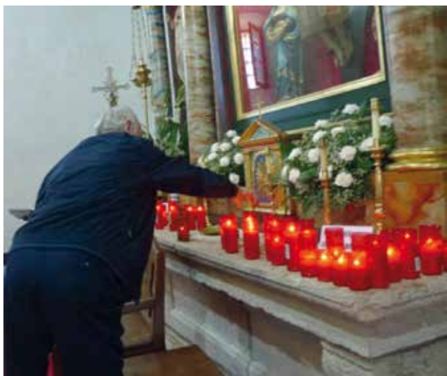
Devoto ofrecendo un velón.

O cumprimento das promesas non so se realiza os días da festividade no santuario, senón que en calquera domingo do ano acoden fieis e devotos doutras comunidades parroquiais para pregar ao Santo Cristo a súa intercesión ante unha serie de peticións.