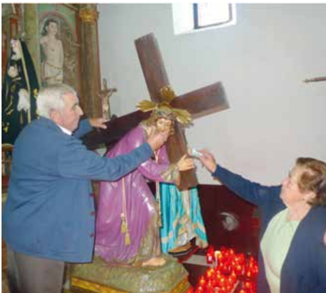
Ritual de contacto activo coa advocación estática.

No flanco dereito do Santuario está situada a “Capela do Santo Cristo”. Bastantes devotos tocan coas súas mans e panos a imaxe do Cristo e, logo, pásanos por algunhas partes dos seus corpos cunha finalidade profiláctica e sandadora.