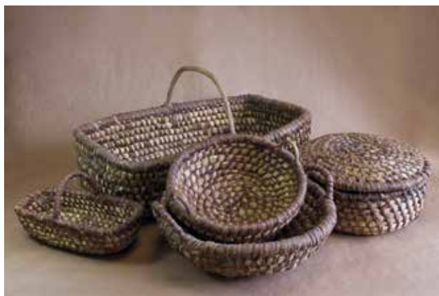
7. Cestos de colmo. Colección Lola Tourón.

Este tipo nace vencellado ao cultivo do cereal, caracterízase pola técnica en espiral, que avanza a partir dun punto central ao redor do que se cose cun movemento en espiral crecente, un tecido apertadísimo que se forraba con resina de pino para reter o líquido, foi una das primeiras técnicas e a máis estendida.