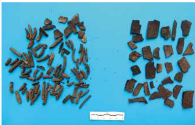
3. Restos de materia orgánica carbonizada posiblemente dun cesto de Castromaior. Depósito Museo do Castro de Viladonga, Lugo.

pallabarro para construcións na maioría dos castros do noroeste Peninsular.