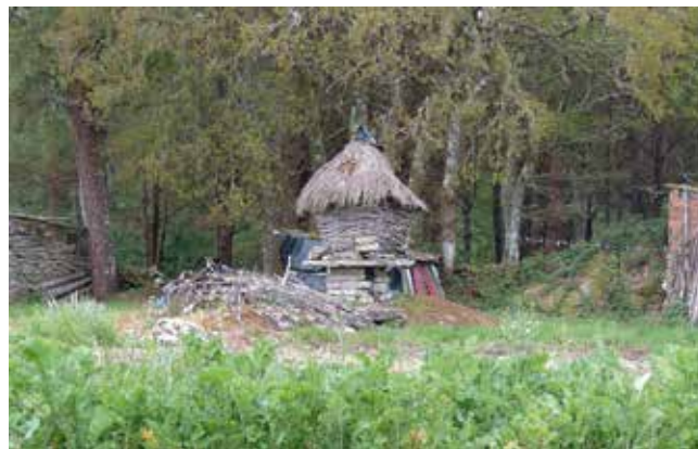
4. Cabaceiro de Viladar, Palas de Rei, Lugo.

O clima e a vexetación da rexión atlántica que nos ocupa, con bosque de folla caduca e clima chuvioso, con vexetación exuberante é un lugar ideal para a cestería de varas. Este tipo de cestería usa numerosas especies vexetais: vimbio, codeso, pau sanguíño. O hórreo, e o seu antecesor o cabaceiro ou canastro, son a versión máis primitiva desta cestería e demostra que a casa e o cesto se unen co mesmo concepto primario, o de seren receptáculo e protección. Os "setos" vivos (sebes), rastros para a terra, colares e soltas para o gando mostran enxeñosas formas milenarias de adaptación ao medio.