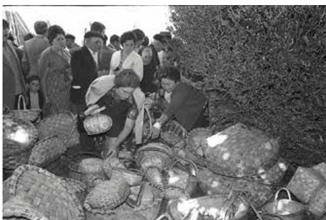
9. Feira de Lugo, foto cedida polo Arquivo Histórico Provincial de Lugo, Fondo Vega.

Destaca a presenza do cesteiro na vida cotiá da Galicia tradicional rural e mariñeira. No mundo da cestería hai todo un patrimonio lingüístico relacionado cos usos e as tipoloxías dos cestos. Como testemuño desta importante presenza está o nome da rúa dos Cesteiros en Vigo. Tamén sinalar que na zona de Mondariz conservouse ata hai ben pouco unha linguaxe específica dos cesteiros símbolo da súa gran importancia na historia desta artesanía en Galicia.