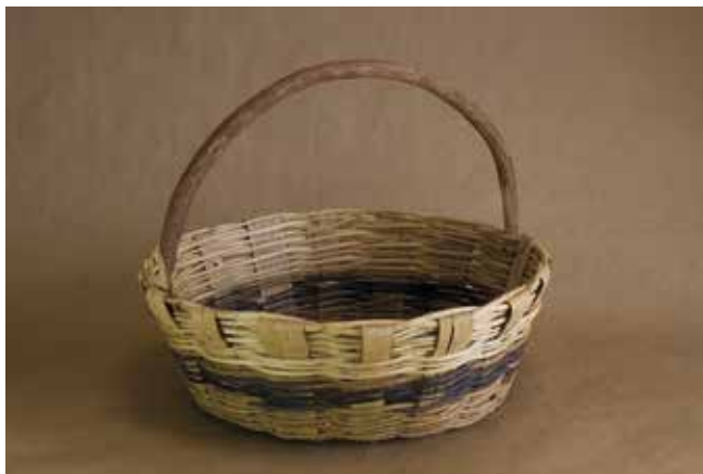
8. Cesta mixta. Colección Lola Tourón.

Destaca a presenza do cesteiro na vida cotiá da Galicia tradicional rural e mariñeira. No mundo da cestería hai todo un patrimonio lingüístico relacionado cos usos e as tipoloxías dos cestos. Como testemuño desta importante presenza está o nome da rúa dos Cesteiros en Vigo. Tamén sinalar que na zona de Mondariz conservouse ata hai ben pouco unha linguaxe específica dos cesteiros símbolo da súa gran importancia na historia desta artesanía en Galicia.