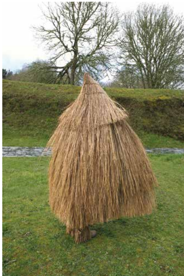
10. Capelo de xuncos. Colección Lola Tourón.

Non debemos esquecer a realización das corozas feitas con xuncos que, probablemente, sexa unha prenda ancestral que levaban os pastores para protexerse da choiva e do frío.