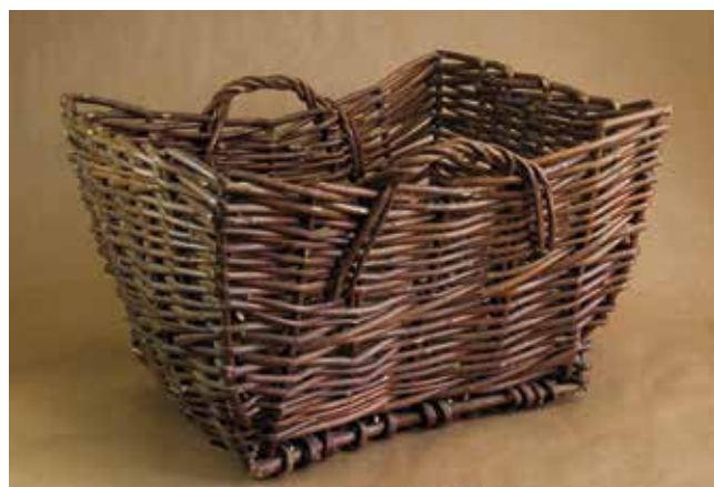
5. Cesta de varas, Colección Lola Tourón.

O clima e a vexetación da rexión atlántica que nos ocupa, con bosque de folla caduca e clima chuvioso, con vexetación exuberante é un lugar ideal para a cestería de varas. Este tipo de cestería usa numerosas especies vexetais: vimbio, codeso, pau sanguíño. O hórreo, e o seu antecesor o cabaceiro ou canastro, son a versión máis primitiva desta cestería e demostra que a casa e o cesto se unen co mesmo concepto primario, o de seren receptáculo e protección. Os "setos" vivos (sebes), rastros para a terra, colares e soltas para o gando mostran enxeñosas formas milenarias de adaptación ao medio.