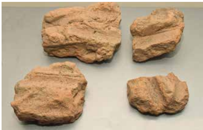
2. Fragmentos de pallabarro do Museo do Castro de Viladonga, Lugo.

Tamén sabemos que nos asentamentos prehistóricos tiñan celeiros soterrados, forrados de cestería para a protección dos alimentos ou forrados de arxila como no caso do xacemento de Monte Buxel en Redondela, cabazas forradas para gardar e transportar líquidos. Ademais de cestos recubertos con barro para o transporte de líquidos e onde, posteriormente, introducían pedras quentes para quecer o contido. Probablemente estes cestos recubertos de barro, ao seren consumidos polo lume deron lugar a unha forma independente de barro moldeado e cocido, isto é a cerámica. A relación entre cestería e cerámica está moi presente nos exemplos de cacharros de barro con decoracións que imitan tramados da cestería como os de tipo campaniforme.