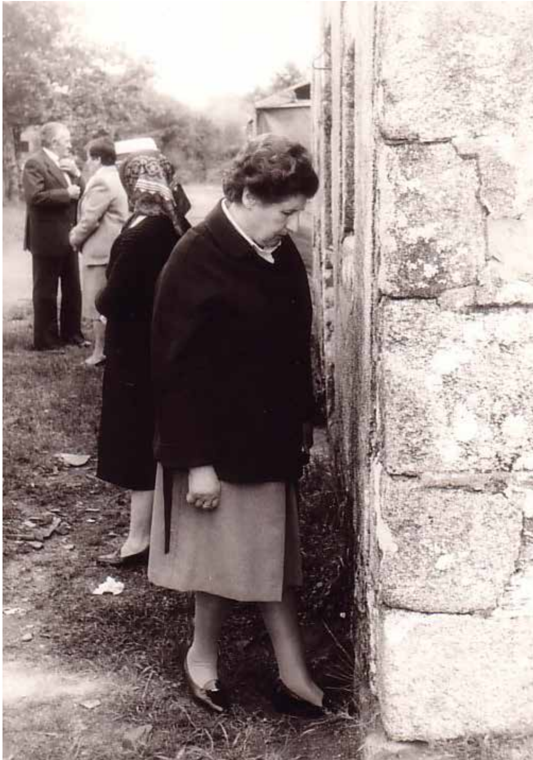
Ritual o “oco no chán” (Carballido)