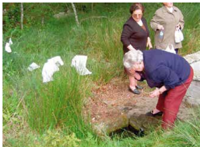
Ritual da fonte (Terrío) (Goiriz)

Por unha banda, algúns devotos lavan cuns panos de mesa e de tea as doenzas ligadas, dun xeito preferente, con garganta, osos e pel, e logo déixanos pendurando por riba dunhas silvas. Tamén adoitan levar botellas de auga para as propias casas coa finalidade de poder continuar co ritual. Ademais había o costume de pedir por si mesmo e por algúns familiares botando miolos de pan na fonte, mentres ían nomeándos un por un. Segundo Xabier Rego, este ritual segue usándose, aínda que menos que antano. Ademais destes rituais, os devotos ofrecen esmola en metálico, candeas, cirios e figuras de cera, que simbolizan o corpo humano parcial ou totalmente, así como a unha serie de animais, como, cabalos, cochos, eguas, vacas etc. Tamén, algúns fieis seguen ofrecendo unha serie de produtos como unllas, cacheiras, queixos etc, que ao rematar os oficios relixiosos son poxados por un fregués da parroquia.