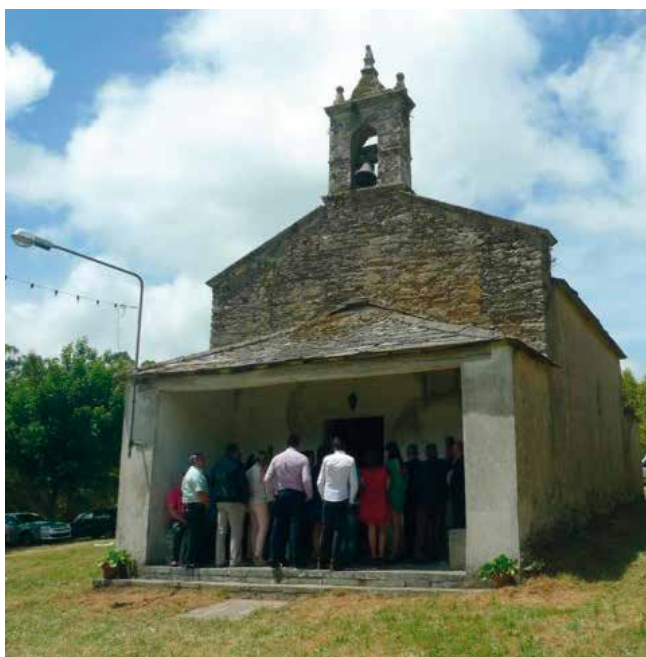
Capela do San Adrián (Fitoiro)

En Carballido (Pacios) (Begonte), o domingo seguinte ao xoves da Ascensión.