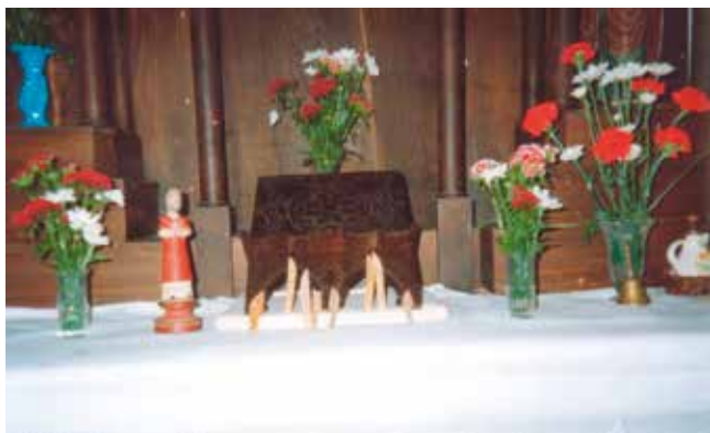
A imaxe e os coitelos do San Adrián pousados no altar (Fitoiro)

Finalmente nos santuarios podemos apreciar a existencia dunha tripla dimensión: