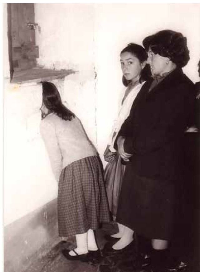
Ritual da "ventá cega" (Carballido)

A capela encóntrase no lugar de Carballido, parroquia de Pacios, pertencente dende o punto de vista eclesiástico ao arciprestado de Begonte e á diocese de Mondoñedo-O Ferrol e dende o civil ao concello de Begonte e á provincia de Lugo.