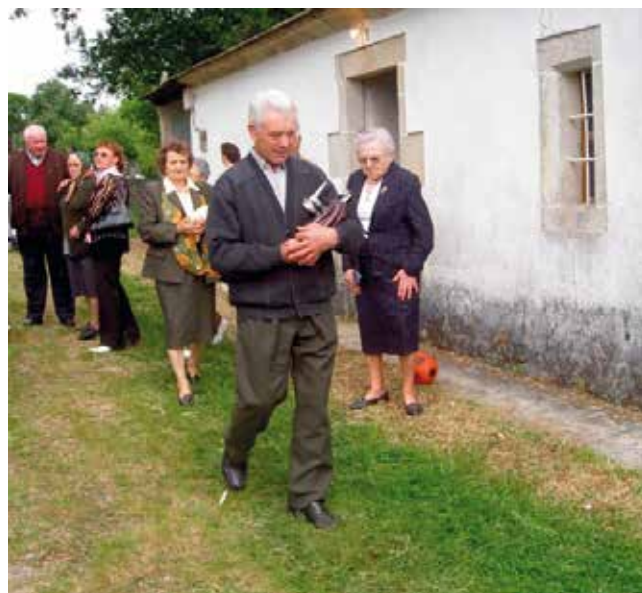
Ritual da circunvalación (Terrío)

Así, realizan o “ritual de circunvalación”, que se fundamenta en dar unha ou máis voltas ao redor da capela, de pé, portando nas súas mans unha imaxe pequena do santo e figuras de cera, representando a animais; e ao corpo humano, enteiro ou parcial.