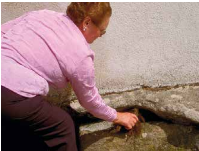
Ritual do sartego (Terrío)