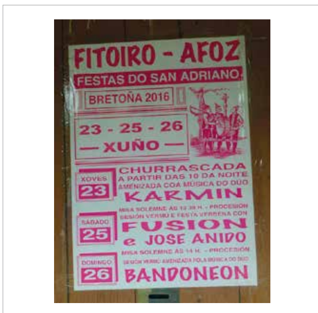
Cartel anunciador da festa.