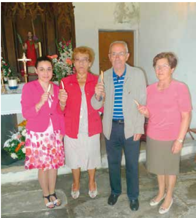
Devotos co “coitelo do san Adrián” (Fitoiro)