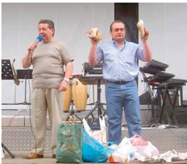
Ritual da "poxa" (Terrío) (Goiriz)

Logo, os devotos, tanto en Fitoiro (Bretoña) como en Terrío (Goiriz), denantes de iniciar a marcha para os seus lugares de orixe, percorren o campo da festa para comprar rosquillas e outros produtos de tipo lúdico. Ademais, aproveitan esta ocasión para comer o polbo e outras viandas. Pola noitiña veñen os mozos da parroquia e doutras comunidades a divertirse na verbena e contribuír deste xeito a que a festa prosiga ata o mencer.