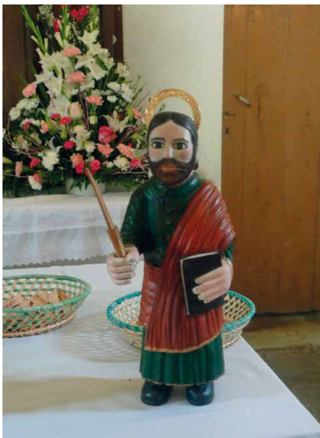
Imaxe pequena para "poñer o santo" (Fitoiro)

Finalmente, os devotos ofrecen esmola en metálico que adoitan entregar no intre de "poñer o santo" ou ben no esmoleiro da capela que posúe unha abertura de cara ó exterior. Tamén entregan candeas, flores e cirios que logo permanecen acesos nun lampadario situado ao carón do altar.