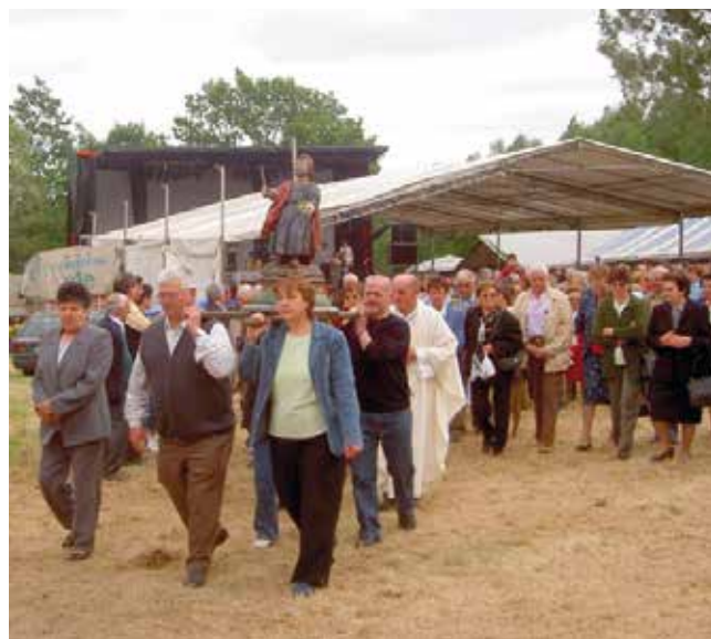
Ritual da procesión (Carballido) (Pacios)