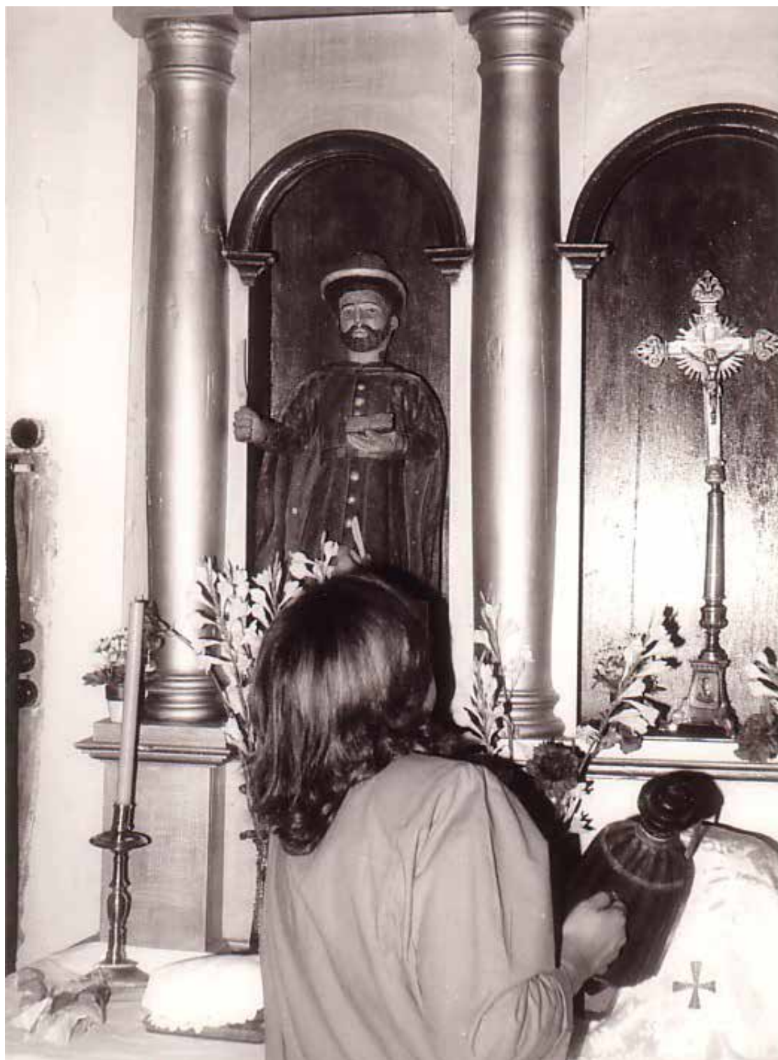
Ritual do "coitelo do San Adrián" (Carballido) (Pacios)