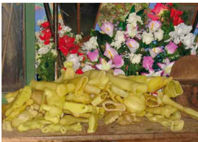
Exvotos de cera. Corpos de animais e humanos (Terrío)

Logo, os devotos, tanto en Fitoiro (Bretoña) como en Terrío (Goiriz), denantes de iniciar a marcha para os seus lugares de orixe, percorren o campo da festa para comprar rosquillas e outros produtos de tipo lúdico. Ademais, aproveitan esta ocasión para comer o polbo e outras viandas. Pola noitiña veñen os mozos da parroquia e doutras comunidades a divertirse na verbena e contribuír deste xeito a que a festa prosiga ata o mencer.