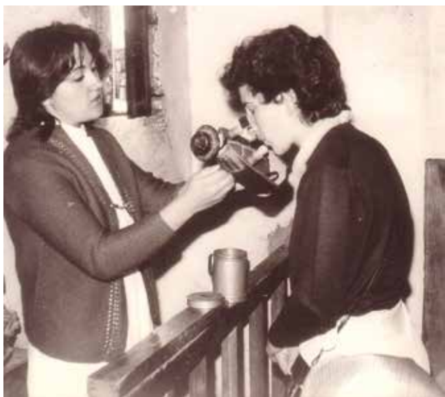
Ritual de “poñer o santo” (Carballido) (Pacios).