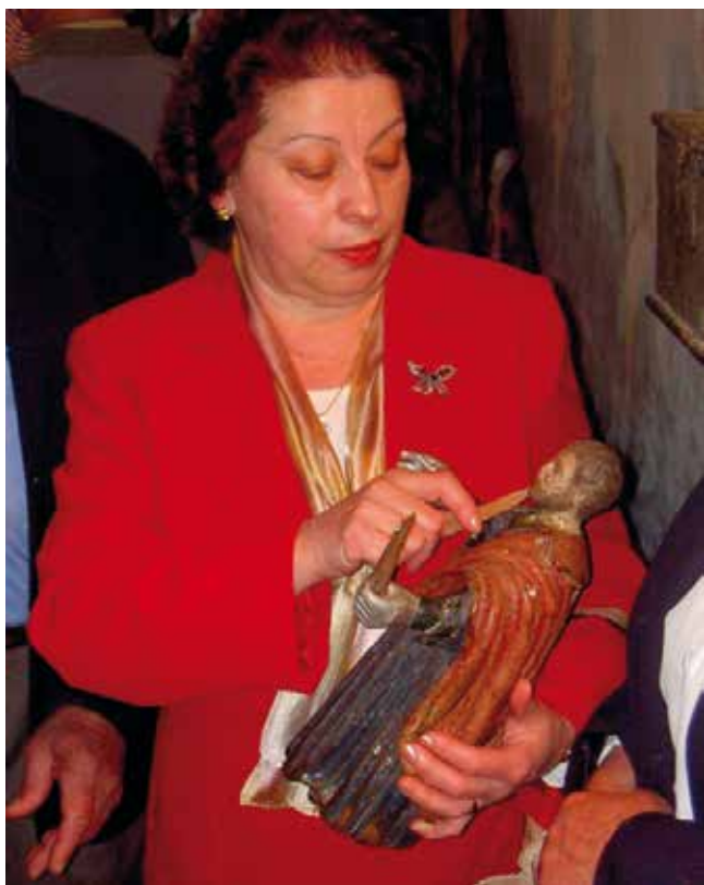
Ritual do “coitelo do San Adrián” (Terrío) (Goiriz).

Na segunda parte, estamos a referir a un ritual divinatório, de “carácter higromántico,” con semellanzas importantes ao existente en San Andres de Teixido (A Régoa) (Cedeira).