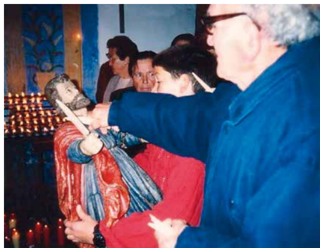
Ritual do "coitelo do San Adrián" (Terrío)

No presbiterio hai un retablo renacentista popular que consta de dous corpos: no primeiro hai unha imaxe barroca do San Pedro; ós lados unha imaxe primitiva do San Adrián, popular, do século XVII, e outro San Adrián, popular tamén, e máis recente. O segundo corpo presenta unha imaxe da Virxe da Inmaculada do século XVII. O retablo remata cun frontón triangular 15 .