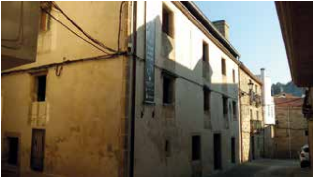
Museo. Rúa Sol

Aberto ao público na Semana Santa de 2011, esta grande arca pétrea garda a memoria gráfica de Laxe e do conxunto da Costa da Morte, e tamén todo aquel patrimonio cultural relacionada coa historia destas terras da fin do mundo e das súas xentes.