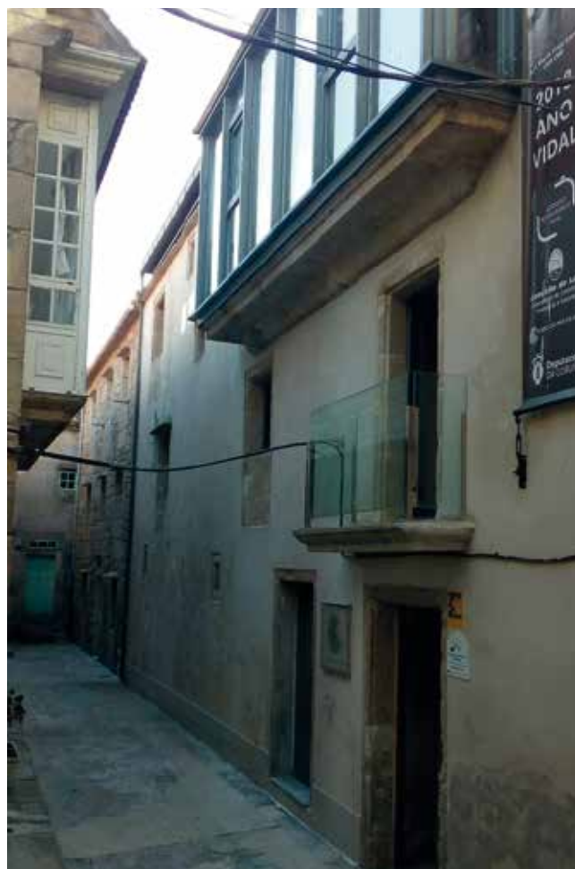
Museo. Rúa Pracer

Escondido como un tesouro no núcleo histórico da vila de Laxe, ao carón da “Casa do Arco,” que fora propiedade dos Condes Moscoso de Altamira, e tamén da casa natal do ilustre xeólogo Isidro Parga Pondal, o noso museo ocupa a totalidade do inmovible que albergou a antiga casa cuartel da Garda Civil da localidade, rehabilitada para este fin, e na que aínda son visibles elementos dunha casa tradicional de pedra, como son a lareira, o lavadoiro de pedra, a latrina, a despensa, entre outros elementos. Ademais está declarado inmovible de elevado interese arquitectónico tradicional.