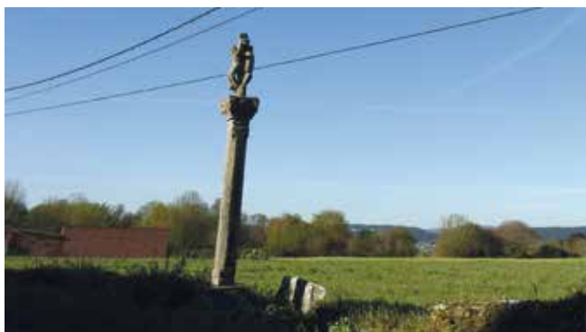
A contorna do cruceiro de Bagueixos

De entre os cruceiros máis antigos e datados 1 do concello de Lugo, este de Bagueixos é sen dúbida o máis senlleiro. Destaca este cruceiro, ademais da súa antigüidade, pola particularidade formal e estilística dalgúns dos seus elementos, que podemos cualificar de únicos ao carecer de paralelismos entre o resto dos monumentos deste tipo existentes neste concello. Está situado a carón dunha pista que, dende a N-VI, á altura do Km. 506, nos leva á igrexa de San Xoán de Tirimol, parroquia á que pertence, non sendo a actual localización 2 o lugar máis axeitado para garantir a integridade e conservación deste monumento, que xa presenta unha ameazante inclinación, así como tamén para a súa posta en valor.