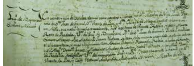
Libro de Bautismos