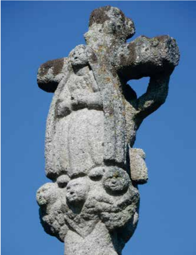
Detalle do reverso