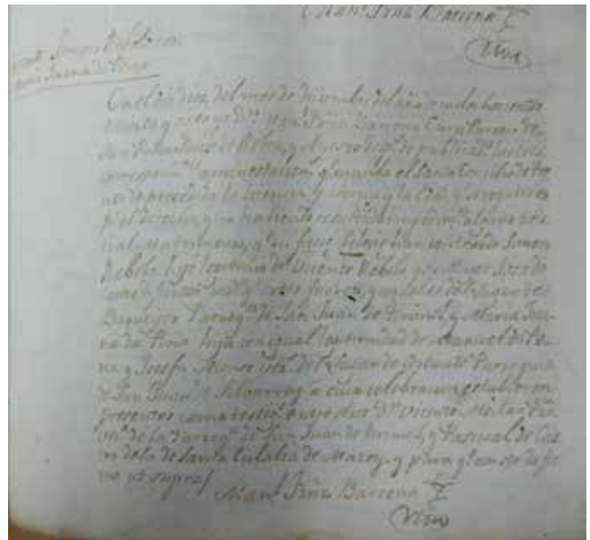
Libro de Matrimonios