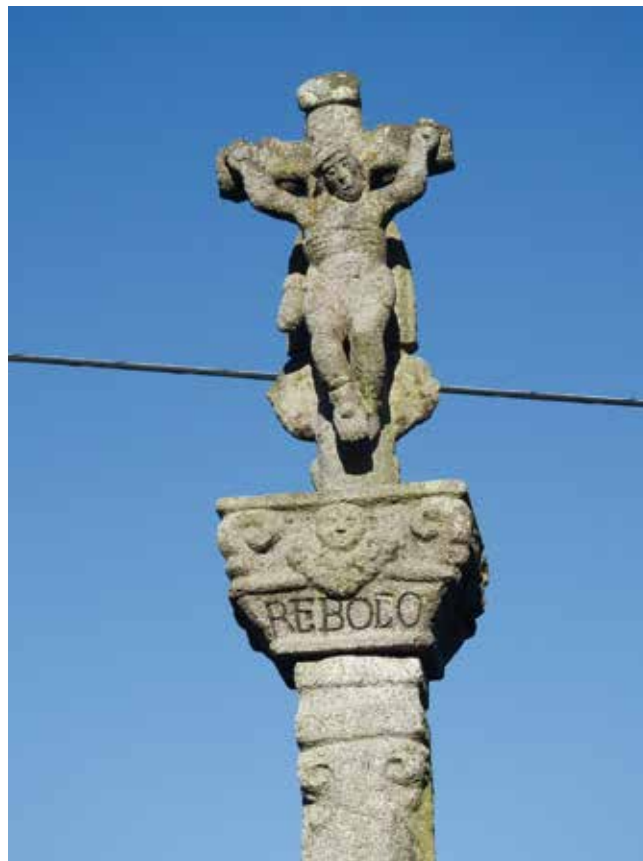
Detalle do anverso

que non ten paralelismos no concello de Lugo e que só nos trae á mente o cruceiro de Caboi, en Outeiro de Rei.