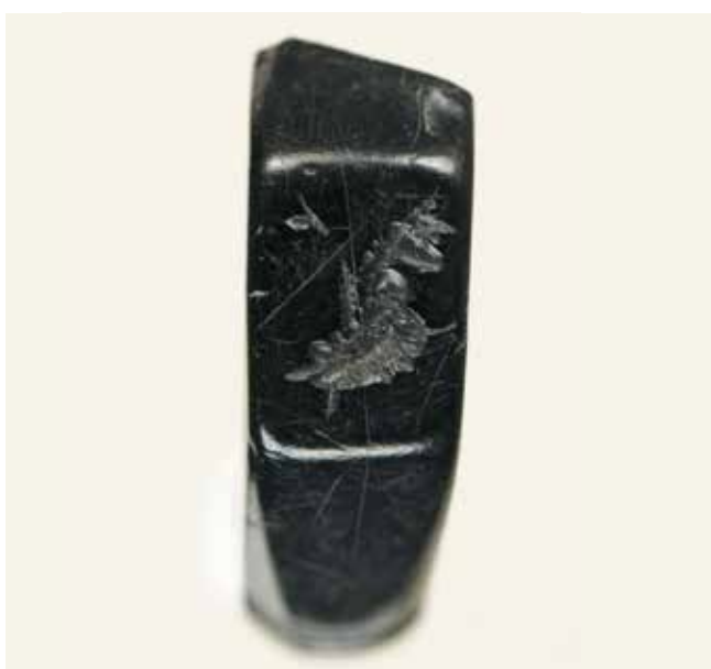
Anillo de azabache