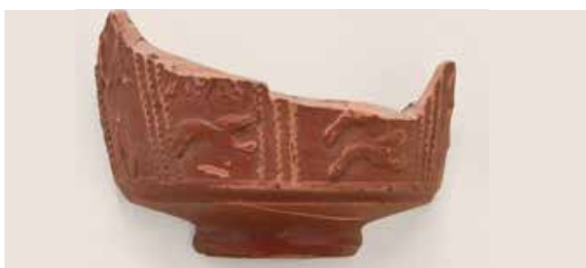
Panza de terra sigillata