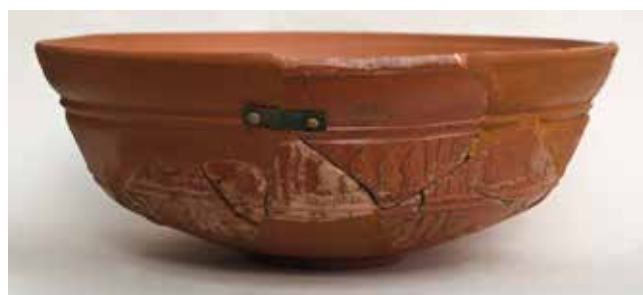
Cuenco de terra sigillata hispánica