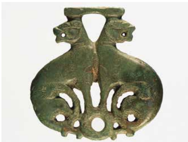
Bocado de freno de caballo