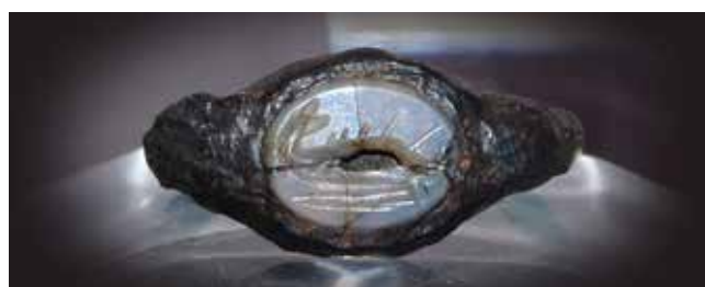
Anillo de hierro con un delfín