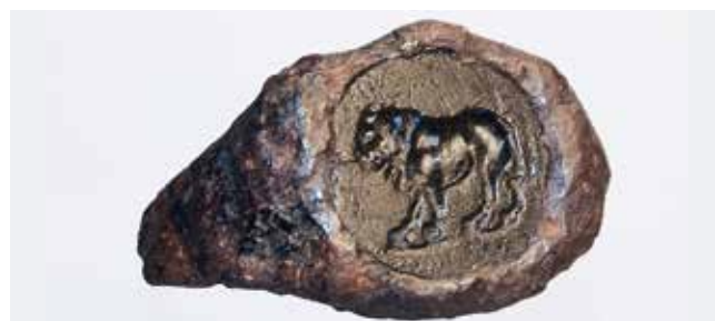
Anillo de hierro con un león