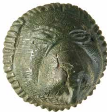
Aplique con cabeza de león