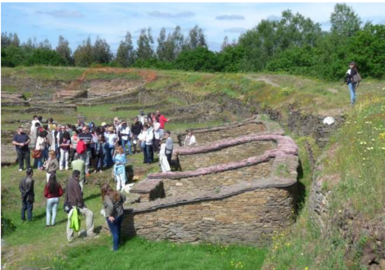
Visita guiada ao Castro de Viladonga

Despois dos relatorios, abriuse un debate no que hai que resaltar o alto grao de participación dos asistentes, que chegaron a esgotar, de sobra, o tempo dispoñible, o que dá pé para pensar que probablemente quedaron moitas cuestións sen expoñer ou tratar.