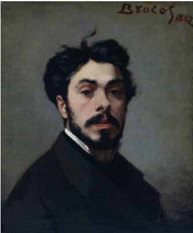
Lám 1. Autoretrato . Modesto Brocos. Óleo sobre lenzo. 55,5x46cm. 1882. Museo de Pontevedra.

Modesto Brocos e Gómez naceu en Santiago de Compostela o 9 de febreiro de 1852, e morreu en Río de Janeiro, o 28 de novembro de 1936.