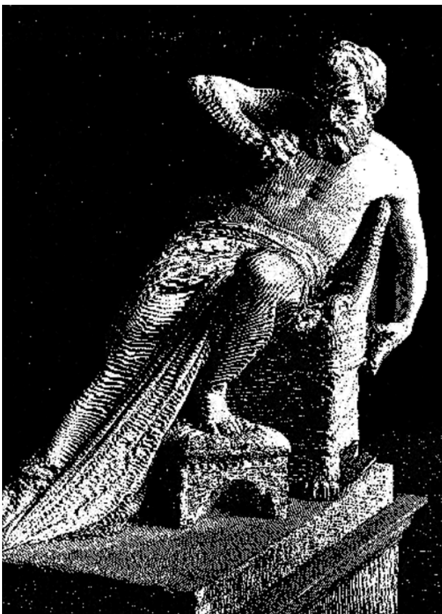
Lám 2: Últimos momentos de Herodes. Modesto Brocos. La Ilustración Gallega y Asturiana . N.º8. 20/03/1879, p. 1.

de Federico de Madrazo. Neste tempo colaborou con ilustracións na Ilustración Gallega y Asturiana , revista dirixida por Manuel Murguía. Un exemplo destas ilustracións é o gravado Últimos momentos de Herodes feito sobre un modelo en xeso, proxecto do seu irmán Isidoro para unha escultura.