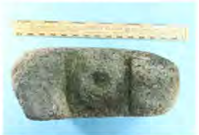
Fig. 2: Vista superior

Trátase dunha peza prismática, de moi boa factura, de granito algo irregular, sobre todo na base, de 27 x 18,5 x 9 cm. de dimensións máximas, coa parte posterior non traballada pero alisada, e que conta con dous roleos ou pulvini laterais moi realzados. Presenta un focus profundo e ben elaborado (Fig. 2).