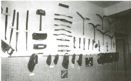
As zocas e a súa ferramenta