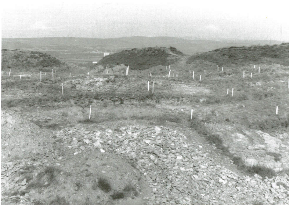
Fotografía do Castro en 1976