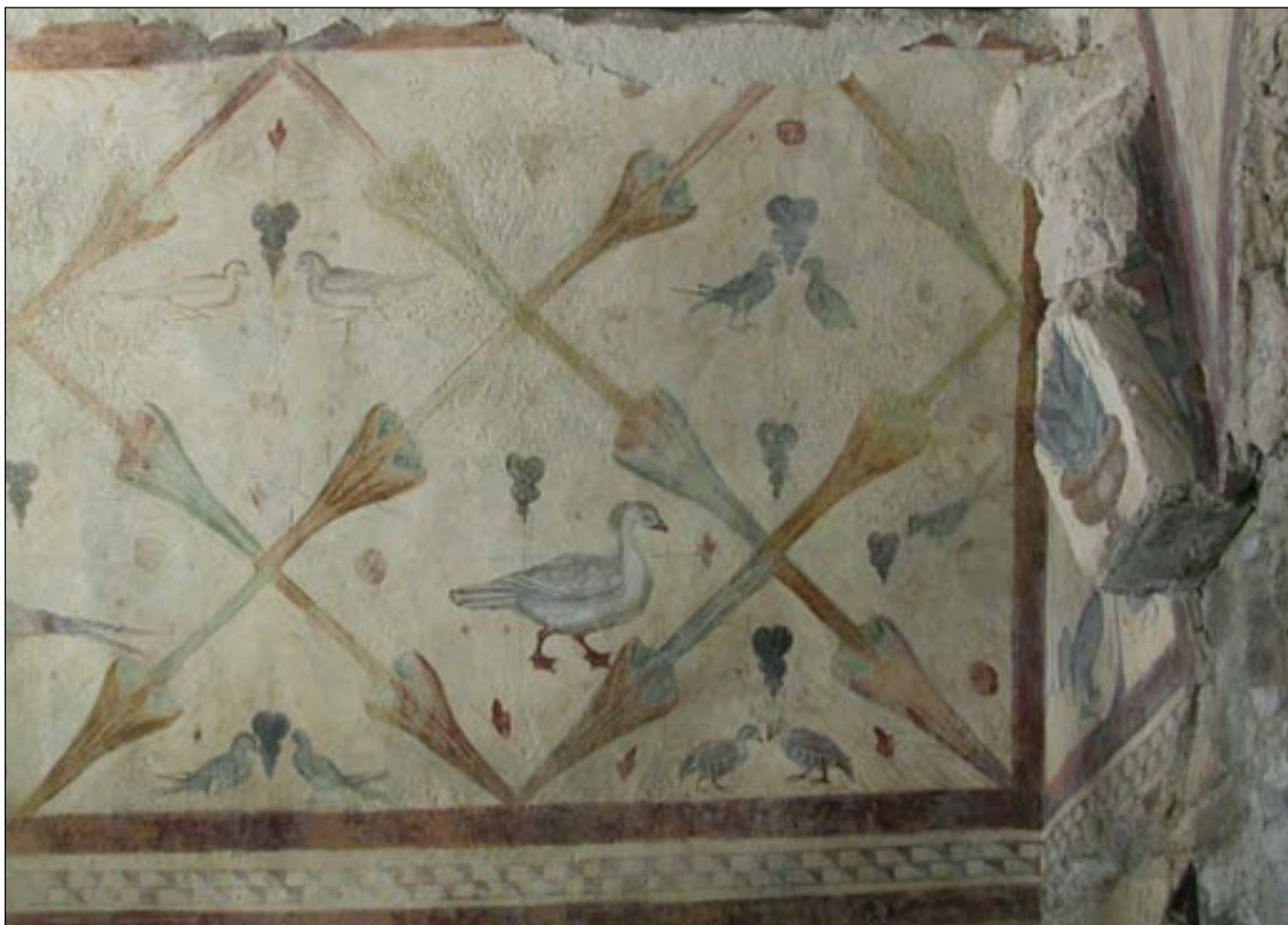
Ilustración 2: Algunos motivos de las pinturas que dan fama a Santa Eulalia de Bóveda. Fondo de la nave lateral sur.

el estudio de la cultura hispanorromana. Sus peculiaridades arquitectónicas y decorativas conllevaron a que desde un principio se planteasen varias opiniones sobre su cronología y funcionalidad.