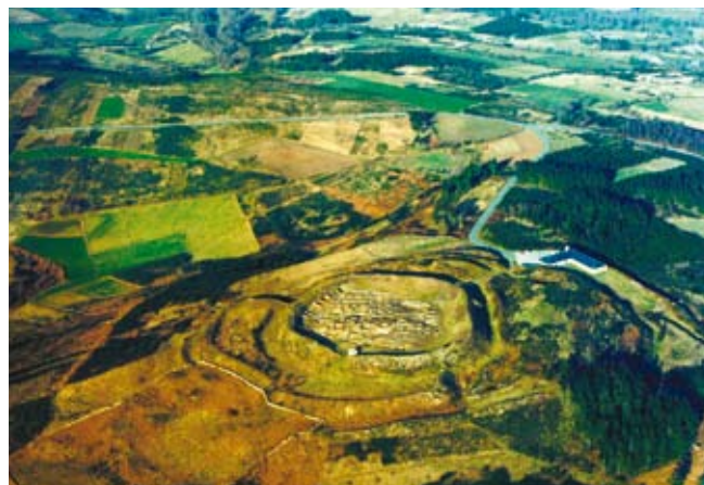
F5. M.C.V. Vista aérea do castro 1985 "Antes todo esto era facenda, para o centeo, non había árbores" 19 .

Podemos apreciar claramente un muro divisorio de parcelamento (F5) dunha agra no antecastro oeste. Este vestixio amosa un uso xa perdido e probablemente o propio muro chegue a desaparecer co tempo; serviría para illar o gando, para que os animais non entrasen a estragar a colleita de centeo cando pastaban nas outras parcelas da agra lindeira. Actualmente esta leira está plantada con eucaliptos. Os topónimos conservados indican tamén este tipo de uso da terra: Agra do Castro.