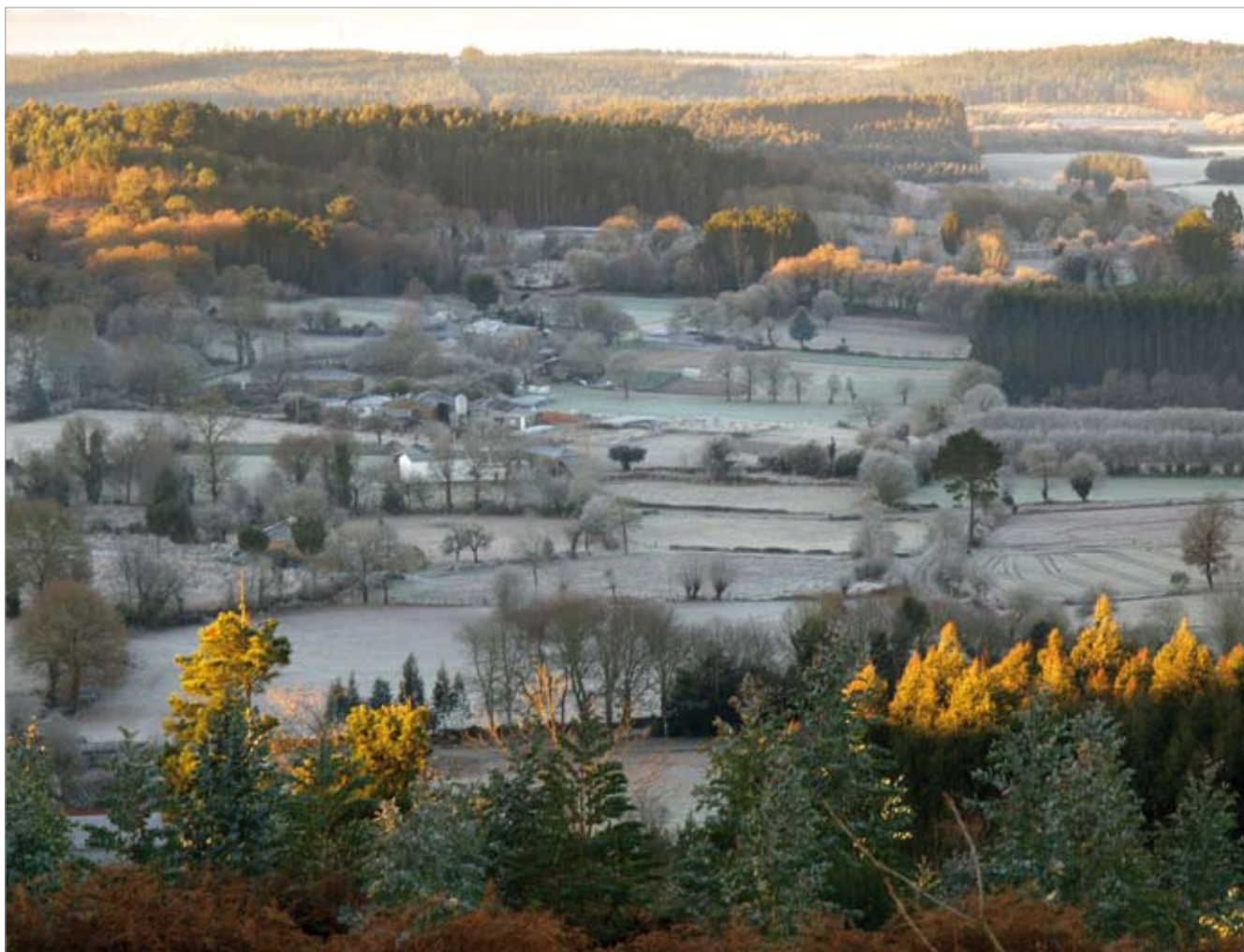
F10 MCV 1 Vista de Ansemar dende o antecastro oeste, inverno 2007.