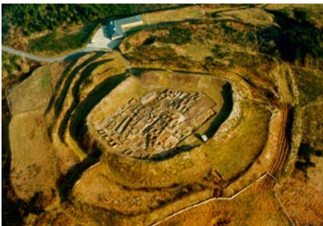
F2. M.C.V vista aérea 1984

mesma do castro, os elementos defensivos e os socalcos dos antecastros, ademais dos usos do solo para cultivo. Trátase dun espazo que tanto física como simbolicamente posúe un contido susceptible de ser estudado dende outras disciplinas, outros puntos de vista diferentes e complementarios ao da arqueoloxía. Ata agora só hai estudos arqueolóxicos sobre el, e algún estudo do folclore e lendas 6 relacionadas. As fotografías aéreas son o punto de partida para facer unha aproximación á evolución das transformacións máis evidentes.