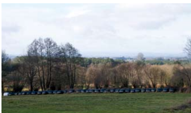
F7 M.C.V. Silos de “rolos”