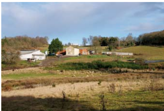
F8 M.C.V. Vivenda e explotación agrogandeira en Ansemar, 2008

O monte xa non achega o estrume porque non se necesita, as novas instalacións recollen os excrementos das vacas e úsanos como adubo para o cultivo; o monte deixa de ter utilidade. Elementos de construción tradicional como os cercados de pedra tamén están en risco de abandono e perda. Na imaxe F8 podemos ver os cambios representados.