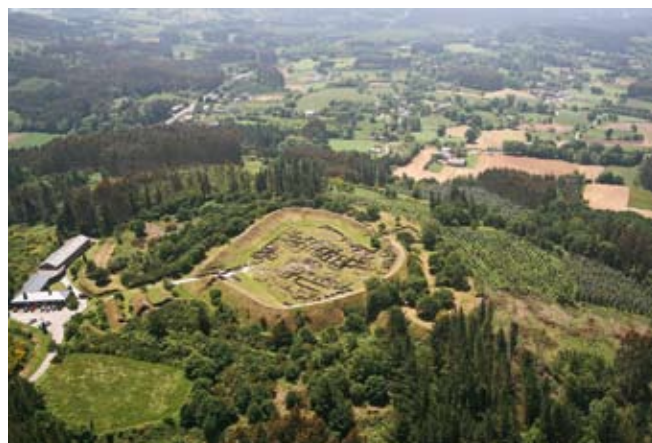
F9 MCV Vista aérea do castro 2007

Este espazo histórico non é alleo ás transformacións. As leiras lindadeiras á croa abandonan os usos tradicionais e agora son sementadas con árbores alóctonas (piñeiros e eucaliptos) que distorsionan a imaxe e a estética do castro. A súa monumentalidade queda anulada, e tamén a súa percepción simbólica e estética. A concentración parcelaria fíxose nas parroquias limítrofes a Viladonga, como son Ansemar, Goberno e outras. Isto reflíctese moi claramente na ampliación de leiras e na inmediata repoboación con árbores alóctonas piñeiros e eucaliptos e o trazado de novas pistas e anulación de camiños tradicionais son outras das consecuencias. A paisaxe homoxeneízase e perde a variedade e riqueza da vexetación autóctona.