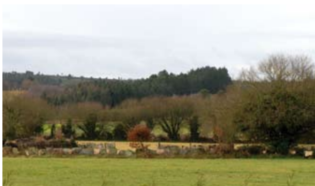
F6 M.C.V. Cercado tradicional

A Colonización 25 inicia uns cambios da produción, do tipo de explotación encamiñada a un monocultivo orientado á pradería artificial que se traduce na paisaxe moi claramente; pasamos a unha paisaxe de praderías artificiais, coa forraxe e o millo como cultivos maioritarios, traducido á súa simplificación e homoxeneización. As vacas de carne Rubia Galega substitúense polas de leite.