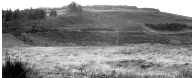
F1. M.C.V. 2 Vista do castro dende o monte Cordal 1982

Na memoria colectiva o castro concíbese tradicionalmente como un lugar que polas súas características formais e o seu contido simbólico é unha paisaxe transformada polo home. A monumentalidade na delimitación do espazo, esa forma artificial que domina a comarca, a súa situación privilexiada no cume dun outeiro e a extraordinaria visibilidade e visibilización, algo que se reflicte na mirada e percepción da xente; polo tanto, non é unha paisaxe 'salvaxe' ou só natural, trátase dunha paisaxe humanizada, un espazo construído e vivo.