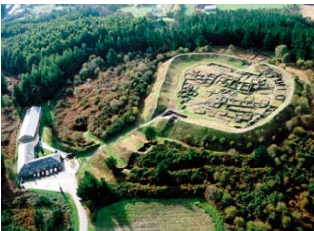
F3. M.C.V vista aérea 2004 (evidencia o impacto da repoboación forestal)