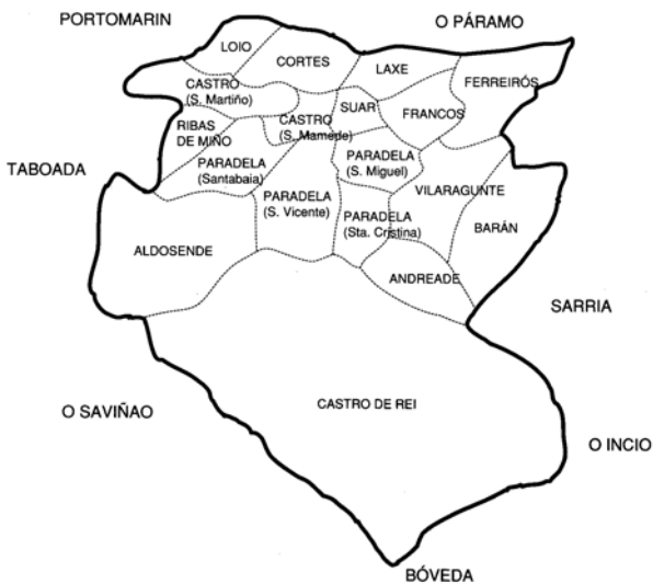
Mapa 1.-Concello de Paradela. Parroquias e concellos limítrofes.

O territorio que abrangue o concello de Paradela, cos seus 121 Km 2 de superficie (Véxase mapa 1), conserva un coñecido e importante legado histórico artístico, principalmente de carácter relixioso, e tamén conta con restos prehistóricos, en particular túmulos megalíticos, pero non tan ben coñecidos como outro tipo de restos.