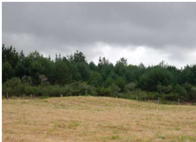
Foto nº3.-Grupo do Rañadoiro. Mámoa nº 26.

A cuarta estaba na leira lindeira coa anterior, próxima ás anteriores e probablemente aliñada con elas. Este lugar tamén é coñecido como “O Marco da Correa da Modorra” ou simplemente “As Modorras”.