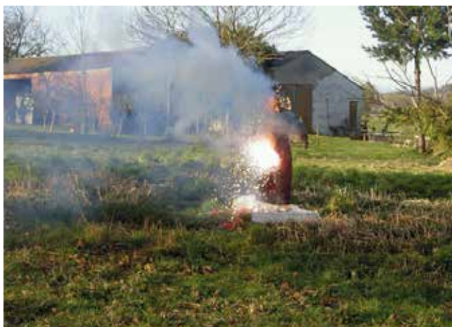
QUEIMA DO ENTROIDO EN "VAL DE FRANCOS". MEDIADOS DA PRIMEIRA DÉCADA DO SÉCULO XXI.

11º. Unha das manifestacións do Entroido, que serve de válvula de escape aos asistentes a algúns dos actos deste tempo festivo e o "riso". Todo vale e todo resulta cómico no tempo do Carnaval. A festa non é posible sen permitir que o sentido do humor domine por unhas horas calquera outro sentimento e se impoña no estado de ánimo 24 . Ademais rirse dun mesmo é sa; é como sacala máscara que nos fai levar a sociedade da vida diaria e desfrutar deixando ver un pouquiño do que levamos por debaixo dela 25 .