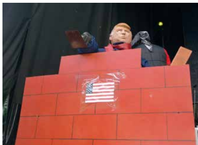
O ENTROIDO SIMBOLIZA AO EX.PRESIDENTE U.S.A. TRUMP 2017.

2.5. Por medio da crítica contra a violencia de xénero. Aquí, apreciaremos, como hai versos encamiñados a censurar unha violencia de xénero, que está canalizada –as máis das veces- do home á muller; mais, tamén hai algúns casos da muller ao home. Esta última, aínda sendo menor, coñecese menos por vergoña, agás nos medios rurais, onde todo chega a coñecerse.