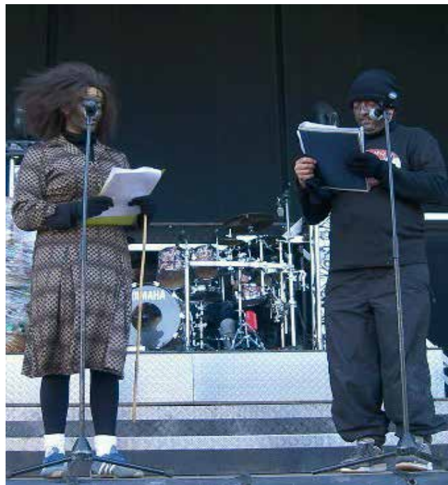
SERMONEIROS EN "VAL DE FRANCOS": 2º ETAPA.

6°. Este tempo representa ademais unha loita entre don Carnal e dona Coresma, reflectida –segundo termos nietzscheanos – pola relación existente entre dos deuses da Grecia antiga, Apolo e Dionisios . Así, o dionisiaco simbolizaba a desorde pública, o instintivo, a vitalidade sen freo, a farra, a irracionalidade. Pola contra, o apolíneo, representaba todo o contrario, é dicir, a racionalidade, a orde social, a ponderación, o esforzo continuo 19 . En consecuencia, hai unha tensión dialéctica entre o apolíneo e o dionisiaco, que se vai resolver co triunfo do apolíneo, e dicir da orde e do control social.