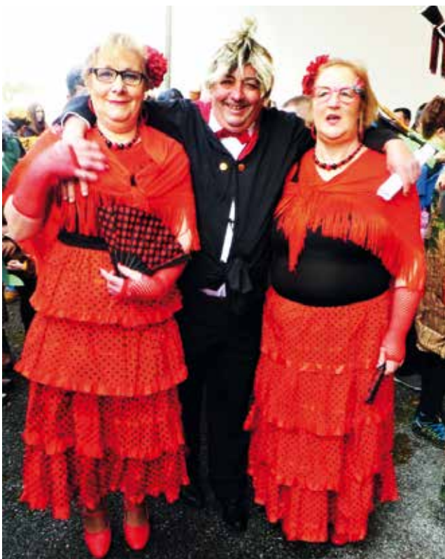
ALGÚNS MEMBROS DA COMISIÓN