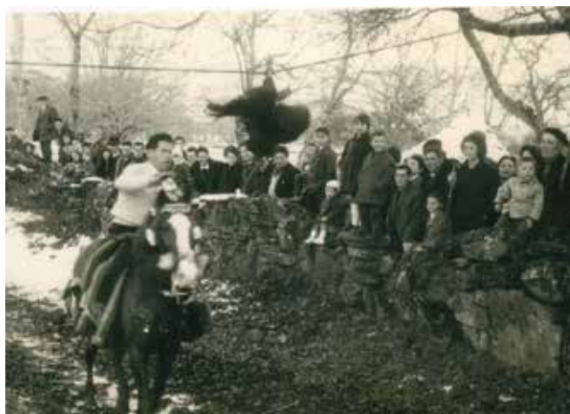
“A CORRIDA DO GALO” NO ANTIGO ANTRÓIDO DE ANSEMAR (CASTRO DE REI).

Agora ben, os días propios da festividade do Entroido, abarcaba –segundo Vicente Risco – unhas tres semanas nas que cumpría sinalar os seguintes días: o domingo fareleiro; o xoves de compadres; o domingo corredeiro; o xoves de comadres; e os días grandes do Entroido, que se correspondían co domingo, luns e martes. Eventualmente, tamén o mércores de cinza. Ademais, é mester facer alusión ao domingo de piñata, primeiro domingo de coresma, que se celebra nalgunhas zonas 6 .