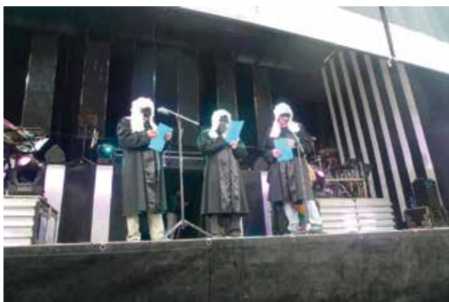
O XUIZO EN "VAL DE FRANCOS. ANO 2013.

Nas parroquias pontevedresas de Santa Cristina de Cobres e San Adrián de Cobres adoitaban poñer un galo, atado nun buraco do chan mais sen enterralo. Logo, os mozos tentaban collelo e nese intre fuxían correndo. No obstante, tiñan que superar un obstáculo importante, consistente na defensa que lle proporcionaban ao galo unha serie de persoas, algunhas con máscara 27 . Pola contra, no municipio coruñés de Zas, penduraban o galo polas pernas dunha corda, situada a certa altura; logo, os mozos viñan correndo e tiñan que saltar o suficiente para conseguir sacarlle o pescozo 28 .