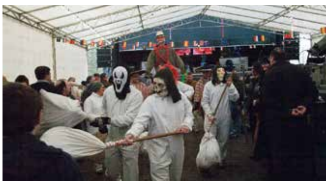
OS FARELEIROS FACENDO PASO A COMITIVA DO ANTROIDO. ANO 2014.

unha manipulación e a un control institucional 29 . Con todo, hoxe, queirámolo ou non, se queremos que a festa continúe temos que botar man das axudas institucionais. E isto debido a que os tempos foron cambiando e as comunidades esmorecendo.