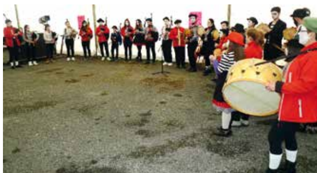
O GRUPO MUSICAL “OS VALUROS” (CASTRO DE REI). ANO 2017

Denantes de comezar a lectura do Sermón, o Entroido –representado por un boneco, vestido con roupas vellas– é colocado nun lugar axeitado do palco da música.