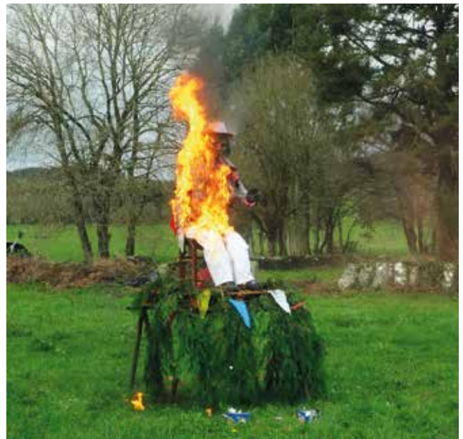
QUEIMA DO ANTROIDO.2020

REY.-Será...¿Y tú, plebeya, me puedes explicar por qué llamándote Letizia, que significa alegría, andas siempre con cara de luto?...Vayamos bajando, pero con cuidado en las escaleras, porque a mi ya no me quedan más caderas que romper. Mi familia y yo les deseamos a todos los presentes y también a los catalanes...¡Unha feliz Navidad y próspero Ano Nuevo!