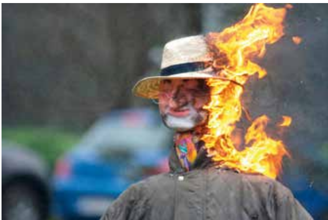
INICIO DA QUEIMA DO ANTROIDO. ANO 2014.

do Entroido vemos chegar a unha parte da familia real, ao “Campo de Carril”; parece ser que invitados por un personaxe nobiliario, vido a menos. Este, era coñecedor que a familia real era deficitaria do aire puro da Chaira; de aí a súa invitación. Se mal non lembro, hai anos os reis, xa fixeran presenza por estas terras chairegas nuns intres diferentes aos actuais, xa que daquela non tiñan déficit deste aire debido a que a capital do Reino estaba máis limpa e con menos ruído. Din que fuxan dos periodistas e non é para menos, xa que sempre foron obxecto da noticia e moita máis agora. Menos mal que tiveron a sorte de encontrar coa susodita invitación e ademais coa gratitude dos paisanos deste fermoso Val de Francos.