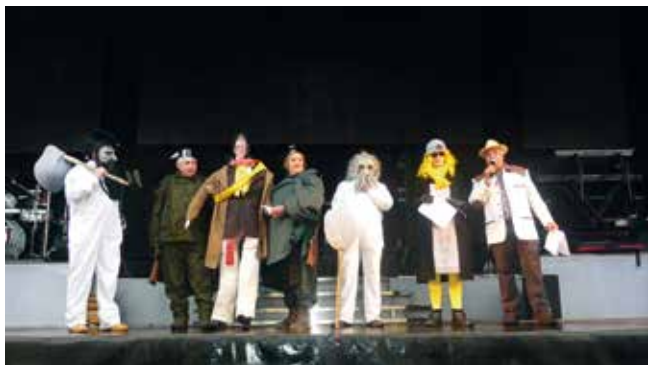
OS FARELEIROS. PARELLA DA GARDA CIVIL SUXETANDO AO ANTOIDIDO E OS SERMONEIROS. ANO 2018.