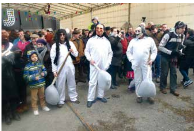
O GRUPO DOS FARELEIROS, MÁSCARA TÍPICA DO "VAL DE FRANCOS"