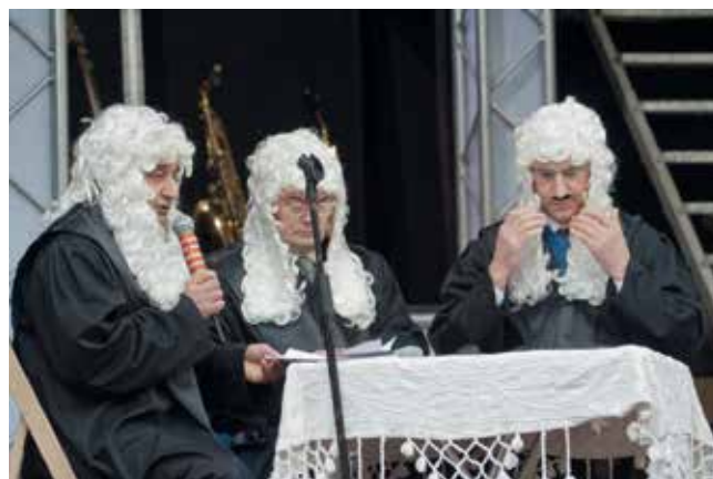
OS MEMBROS DO XULGADO. ANO 2015.

"Discútenche coma cans/ nunca se poñen de acordo,/ no único que coinciden,/ e para subírense o soldo"/.