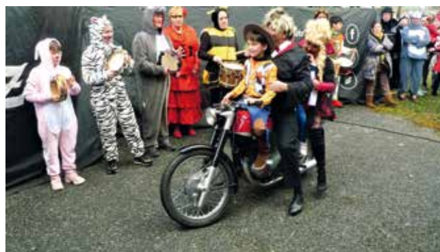
CHEGADA DOS SERMONEIROS AO RECINTO FESTIVO. ANO 2020.