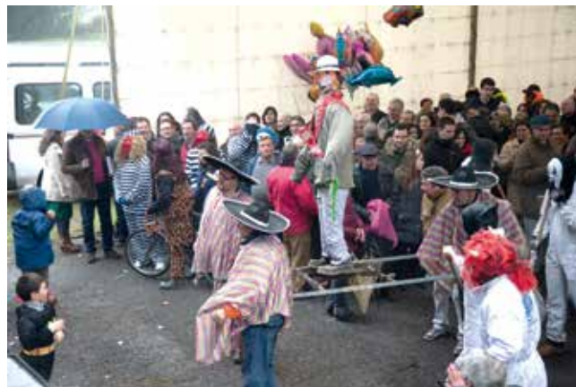
PORTANDO AO ANTROIDO PARA A QUEIMA. ANO 2014.

Polo tanto, diante desta situación calamitosa, indignante e de auténtico caos, tanto un xuíz como un fiscal honorables, téñeno fácil para buscar culpables e para xulgar en consecuencia. Pola contra, o avogado defensor teno -ao menos teoricamente -moi arduo e difícil.