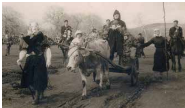
O ANTROIDO ANTIGO EN ANSEMAR.

estudio foi defendida, entre outros, por autores como Frazer, Gaignebet .