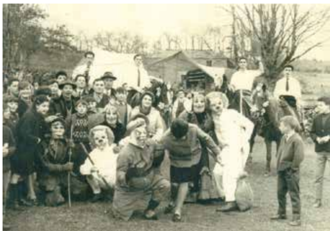
O ENTROIDO ANTIGO EN ANSEMAR (CASTRO DE REI)

3°. No Entroido estamos ritualizando o lado escuro e funesto do ser humano. A súa animalidade, as súas máis baixas paixóns, os seus excesos na comida e na bebida.