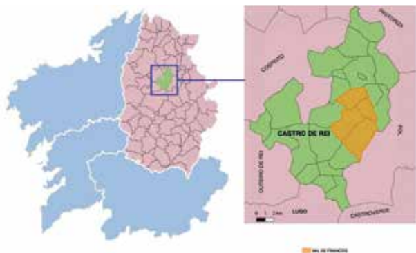
1. LOCALIZACIÓN DO “VAL DE FRANCOS” 30