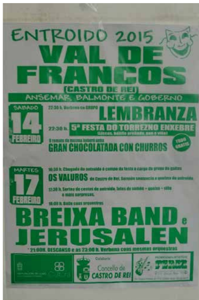
CARTEL DO ANTROIDO. ANO 2015

Durante os seis primeiros anos a conmemoración festiva levouse a cabo os sábados pola noite, e o martes, día principal. Nos últimos catro anos o evento festivo concentrouse no "Martes de Entroido". Neste período cómpre distinguir os seguintes actos e persoeiros do Entroido.