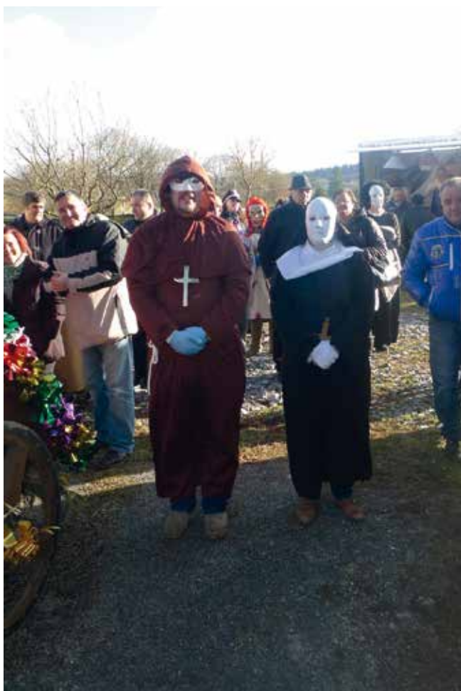
MÁSCARAS DO ANTROIDO. ANO 2015.

"Estamos vivindo unhos tempos/ que non sabes donde vas/ cos políticos que temos/ mal educados como cás"/.