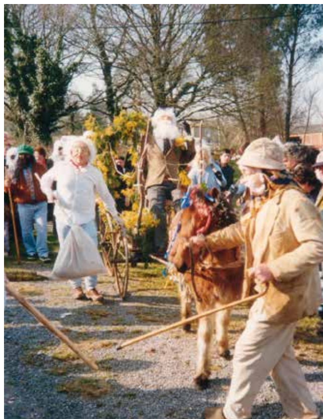
A COMITIVA DO ANROIDO. 2009

12º. É un tempo de alegría, de diversión, de exceso na comida e na bebida. O elemento sexual aparece reflectido en certos xogos como o das olas; o do pucheiro; nas disputas que había nos xoves de compadres e comadres; no costume de que as máscaras lles levanten as saias ás mulleres e se metan con elas 26 . Así mesmo, as corridas do galo teñen un compoñente sexual importante, xa que o galo é un dos animais máis simbólicos do Entroido en canto á carnalidade e luxuria.