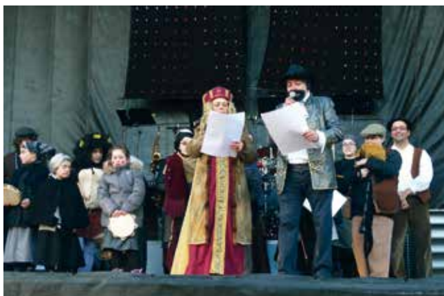
OS SERMONEIROS DO ANO 2015.

Carme: "Acheugas históricas ao Antroido de Val de Francos (Castro de Rei) no século XXI," publicado no nº 19 da Rev. Croa , 2009. Fai mención a diferentes sermóns e xuízos desta etapa.